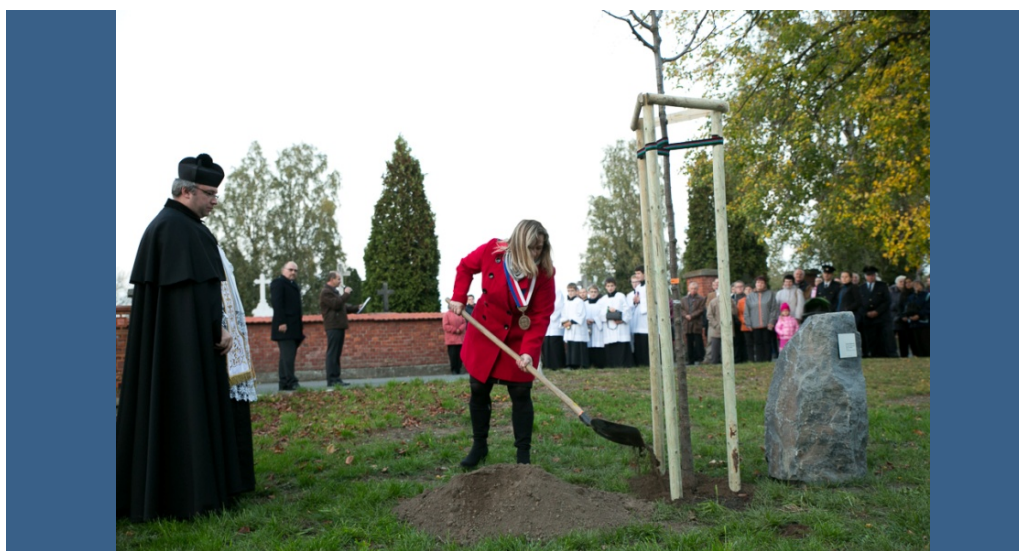
Oslavy 100 let republiky - Hustopeče nad Bečvou