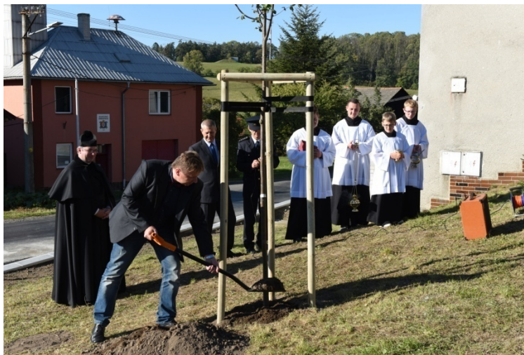
Strom svobody - Vysoká

Loňský rok se nesl ve znamení oslav 100 let republiky. Tohoto jubilea využilo i spousta obcí a uspořádaly v říjnu oslavy. Některé obce v našem mikroregionu oslovila i akce Nadace Partnerství – Strom svobody zdarma. Obce tak zorganizovaly v rámci oslav i novou výsadbu. Dle dostupných informací nadace se akce vydařily nejen v našem regionu, ale v celé republice. Výsadbu pojaly obce různými způsoby, některé pozvaly a zapojily své občany do výsadby, u některých se jednalo o školní vzdělávací akci, kde se výsadby ujali samotní žáci. U většiny oslav nechyběla hudba a dobré pohoštění. Samotnou výsadbou pak akce nekončila, ale naopak začínala a pokračovala do nočních hodin. V akci s Nadací Partnerství byly zapojeny obce: Hustopeče nad Bečvou, Býškovice, Horní Újezd, Černotín a Vysoká