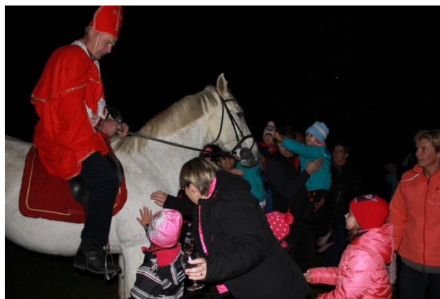
Příjezd sv. Martina - Klokočí