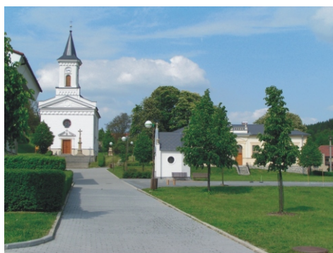
Střítež nad Ludinou