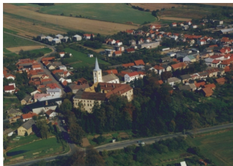
Hustopeče nad Bečvou