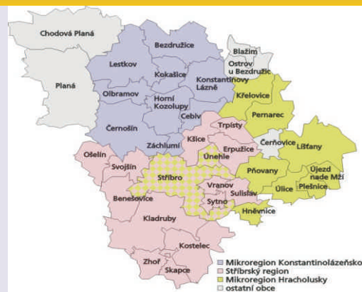
Území MAS Český Západ - Místní partnerství

ná a městyse Chodová Planá. Na jejím území žije více než 28 tisíc obyvatel v převážně malých venkovských obcích a pěti malých městech – Stříbře, Plané, Bezdruzicích, Kladrubech a Černošíně. Blízkost bývalých západoněmeckých hranic a fakt, že velká část území spadá do bývalých Sudet je bohužel dodnes znát na stavu mnoha místních památek, ale i objektů občanské vybavenosti, na druhou stranu místní komunita ožívá díky zápalu mnoha místních aktivních lidí, jichž MAS sdružuje hned několik desítek. Místní akční skupina byla založena v březnu roku