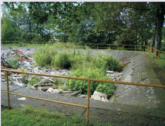
Bývalou požární nádrž v Býškovicích již brzy nahradí nové vícelúčelové hřiště

V oblasti cestovního ruchu se sice neobjevil nikdo s plánem vybudovat zcela nové ubytování, 2 úspěšní žadatelé se ale soustředí na další vylepšení prostor pro ubytované hosty. Penzion Ostravanka v Teplicích nad Bečvou je už tradiční adresou lázeňských hostů, kteří se jezdí do regionu léčit či jen rekreovat. Díky dotaci budou dispozičně změněny některé pokoje, přibudou v nich sprchové kouty a sociální zařízení tak, aby každý host našel toto zázemí