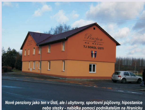
Nové penziony jako ten v Ústí, ale i ubytovny, sportovní půjčovny, hipostance nebo stezky - nabídka pomoci podnikatelům na Hranicku

pro přenocování koní turistů. Součástí mohou být prostory pro ustájení a uvázání koní turistů (výběhy, ohrady, venkovní či vnitřní boxy pevně se zemí spojené, úvaziště, apod.), zařízení pro uložení jezdecké výstroje či vybavení pro péči o koně turistů a jejich krmění. Důležitou podmínkou je, že dotace je určena buď pro zemědělské podnikatele, nebo pro jakékoliv jiné podnikatele, kteří ovšem v oblasti cestovního ruchu podnikají méně než 2 roky.