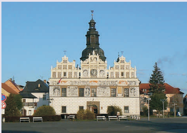
Budova radnice ve Stříbrě

V letech 2004 – 2006 realizovala MAS Český Západ – Místní partnerství celkem čtyři programy na principech iniciativy LEADER a to: LEADER ČR 2004, 2006 a LEADER+. Obsahem nejzajímavější