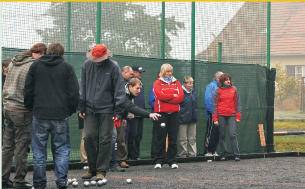
Den s regionem Hranicko ve Valšovicích: do turnaje v pétanque se zapojilo hned 17 týmů