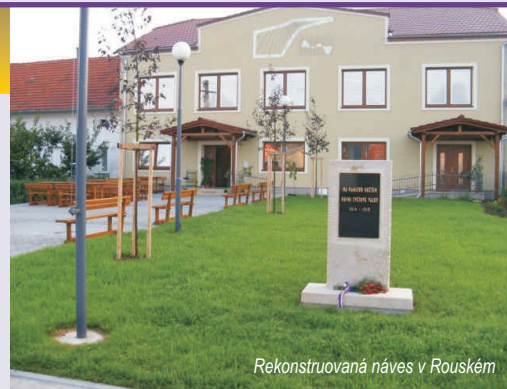
Rekonstruovaná náves v Rouském