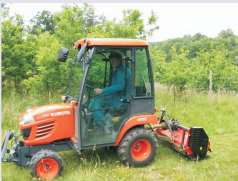
Nový traktor obce Teplice n.B.