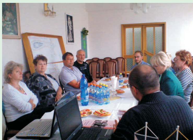
Na vzniku muzeí se aktivně podílejí místní obyvatelé, tak jako ve Všechovicích