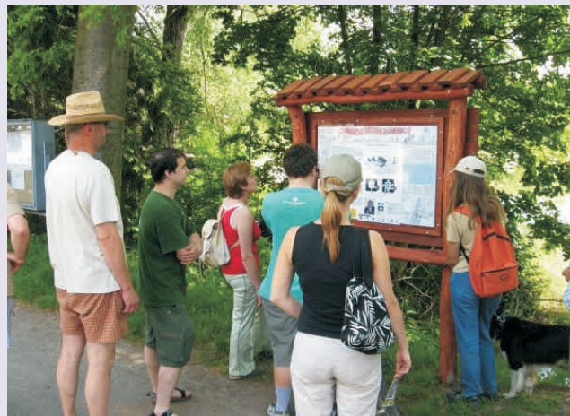
Naučných stezek na Hranicku je zatím poskovnu

Z uvažovaných nových oblastí přichází v úvahu 2 případné nové Fiche, které ovšem budou do Programu LEADER zařazeny, jen pokud bude prokázán dostatečný zájem žadatelů. Do oblasti cestovního ruchu míří zvažovaná fiche zaměřená na vznik pěších tras a hipostezek. 90% dotaci by bylo možno získat na různé naučné a koňské stezky, turistické značení, odpočívky a infotabule včetně nutných úprav povrchů. Tuto možnost sice už nyní nabízí výše popsaná Fiche č.7, u nové Fiche by se však pře-