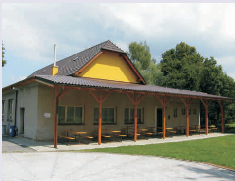
Zastřešená část vyletiště ve Skaličce