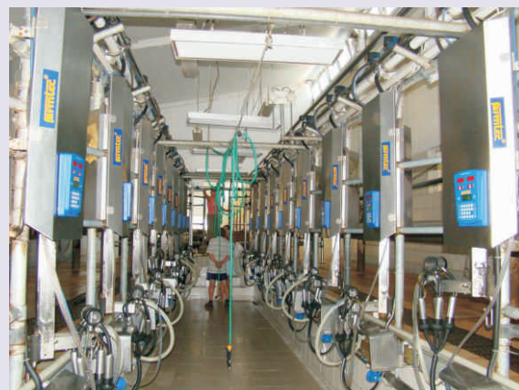
Zemědělci mohou vylepšit stavby a technologie, tak jako se to podařilo v ZD Partutovice

Zatím jen 1 žadatel projevil vloni zájem o fichi č. 1 Rozvoj zemědělských podniků. Přitom možností, jak peníze využít je nepřeberné množství. Bohužel nadále není možné získat podporu pro mobilní stroje, dotace ale mohou směřovat do stavebních úprav, rekonstrukcí i nové výstavby objektů pro rostlinnou a živo-