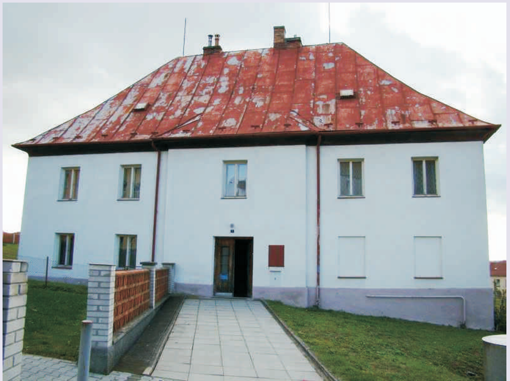
Neobydlená část fary v Běloučíně se promění v muzeum

Čerstvě připraveným a podaným počinem je pak příspěvek k zachování a zhodnocování kulturního dědictví našeho venkova. Rozvojové partnerství spolu s MAS Mohelnicko připravily záměr na vybudování stálých expozic ve svých regionech. Pokud bude společná Žádost o dotaci schválena, bude do 4 nevyužitých prostor investováno skoro 5 miliónů Kč, které se díky tomu promění v muzea: v Polici na Mohelnicku vznikne Síň selských tradic, v Lošticích se pak rekonstrukce dočká interiér židovské synagogy, kde vznikne expozice připomínající stopy a odkaz života židovského etnika v Lošticích. Na Hranicku se expozice soustředí na 2 polozapomenuté významné osobnosti nedávné historie. Bělotínská fara byla v minulém století dlouholetým působištěm pa-