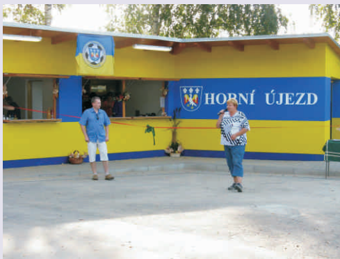
Zázemí pro sport v Horním Újezdě

lepšilo díky dotaci technologii na dojení včetně elektronické identifikace krav. Krásnými upravenými prostranstvími se už mohou také pochlubit 3 obce z Hranicka. Díky dotaci se podařilo obnovit zelené plochy a parčíky v centru Opatovic, část návsi v Rouském nebo prostranství kolem kostela v Ústí. Ukončené jsou také 3 projekty z oblasti volnočasových aktivit. V Horním Újezdu už lidem slouží nový objekt zázemí pro sportovní aktivity v sousedství hřiště, v Klokočích už knihovna využívá nové vybavení a ve Skaličce se podařilo zabránit zatékání do kulturního domu rekonstrukcí střechy, přibýlo také zastřešení části vyletiště. Více než slova o dobře vykonaném díle jistě prozradí malá fotogalerie vybraných projektů.