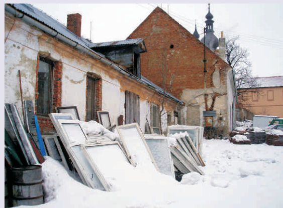
Tato budova jako spousta jiných čeká na své nové využití

Jak často a které mobilní vybavení byste využívali? Pódium, velkokapacitní stany, zvukovou či světelnou aparaturu, výstavní klipy, prodejní stánky, sady lavic a stolů, výčepní