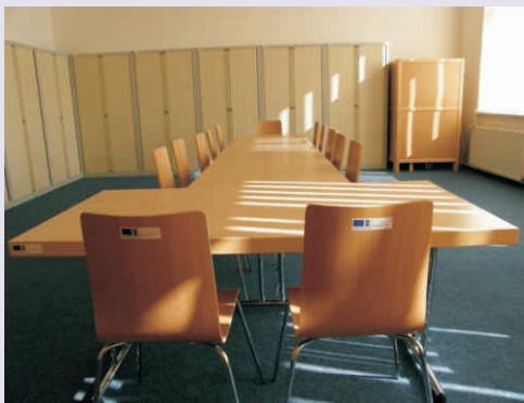
Nové vybavení knihovny v Klokočích