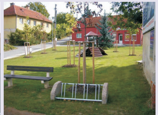
Nové veřejné prostranství v Opatovicích