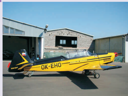
Už příští rok bude dokončena přístavba na drahotušském letišti

Začátkem listopadu SZIF definitivně potvrdil výběr MAS a projektům schválil doporučenou výši dotaci. Přejeme všem příjemcům úspěšnou realizaci projektů!