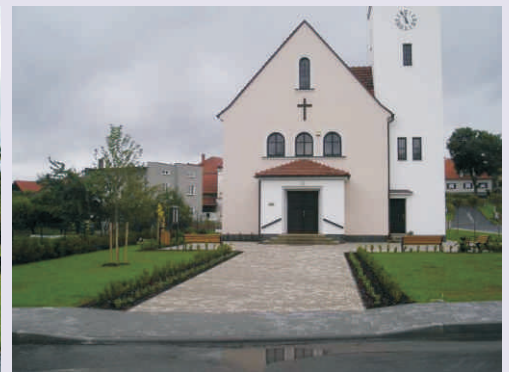
Obnovené prostranství v Ústí