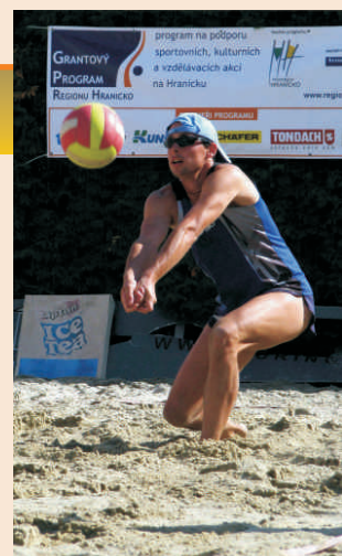
Switch Cup 2009 v Drahotuších