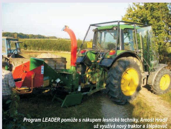
Program LEADER pomůže s nákupem lesnické techniky, Arnošt Hradil už využívá nový traktor a štěpkovač

U lesních hospodářů je naopak mobilní technika umožněna a je přímo hlavním předmětem možné dotace. Žadatelem se může stát