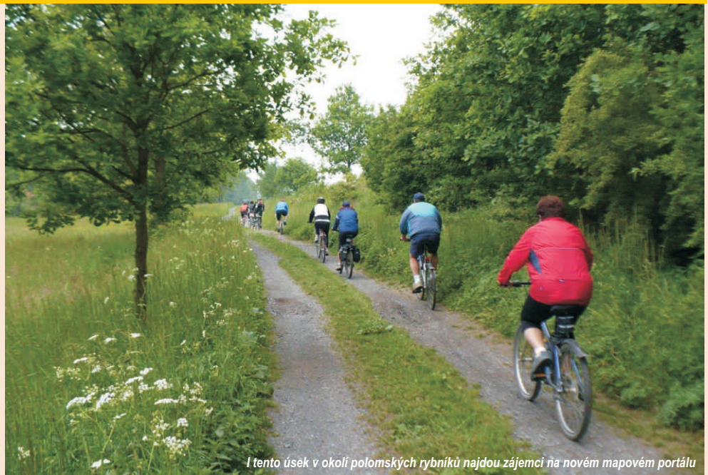
I tento úsek v okolí polomských rybníků najdou zájemci na novém mapovém portálu

Jednou ze zajímavých a významných aktivit projektu na podporu cestovního ruchu v turistických lokalitách Hranicko a Dolina Malej Panwi je vznik mapového portálu cykloturistických tras v regionu Hranicko. Jedná se o virtuální obdobu klasické papírové mapy s tím, že tento systém funguje on-line. Návštěvník má možnost si předem prohlédnout trasu, její profil a délku, a to ještě dřív, než se dostane do regionu nebo se mu mapa dostane fyzicky do rukou. Jsou zde vyznačena turisticky zajímavá místa, památky, restaurace, ubytovací zařízení a další atraktivity a služby. Tento portál funguje na www.hranicko.eu , což jsou stránky, kde by měl každý turista a návštěvník regionu najít veškeré potřebné informace týkající se turismu a cestovního ruchu na Hranicku. Na přípravě se také aktivně podílí pracovní skupina projektu, která se pravidelně schází a komentuje všechny probíhající i plánované aktivity. Ne jinak je tomu i v případě tohoto mapového portálu.