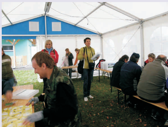
Stany v majetku MR Rozvodí se už v regionu hojně využívají, brzy k nim přibude další moderní vybavení

K realizaci projektu Spolupráce „Zmapování a marketing nevyužitých prostor“ se spojily tři moravské místní akční skupiny. Kromě té naší ještě MAS Mohelnicko a MAS Na cestě k prosperitě působící v okolí Němčic nad Hanou. Ti všichni chtějí projektem přispět k řešení problematiky brownfields a chátrání nevyužitých objektů a prostor. Lidé si většinou nejdříve představí opuštěné kravíny a nefunkční průmyslové provozy, které nás sice na Hranicku také tíží, svou velikostí a složitostí řešení už však překračují naše možnosti. Trochu stranou zájmu však stojí velké množství menších nevyužitých místností v obecních úřadech, školách, kulturních domech, domech služeb, různé opuštěné dílny a menší výroby. Takový začínající podnikatel či živnostník, když bude chtít najít vhodný prostor pro rozjezd svého podnikání, musí pracně objíždět jednotlivé ob-