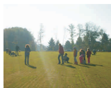
Travnaté hřiště ve Stříteži n.L.