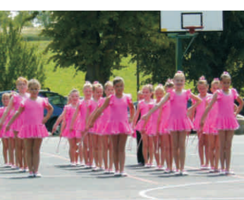
Víceúčelové hřiště Býškovice