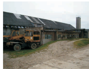
Zemědělský areál v Horním Újezdě

Dosud tedy bylo v Programu LEADER „Měníme Hranicko“ vyplaceno či přislíbeno 43 projektům celkem 25 milionů Kč. Program se po třech letech dostal do své poloviny, což je ideální příležitost pro důkladnější rozbor dosud rozdělených financí. Ty mají totiž sloužit k naplňování Strategického plánu LEADER, který si Rozvojové partnerství stanovilo už v roce 2007. Nyní lze tedy porovnat, zda dotované projekty opravdu naplňují předsevzaté cíle, zda jednotlivé sektory podporujeme ve stanoveném rozsahu, jestli pro výběr používáme vhodně zvolená preferenční kritéria. Výsledkem této analýzy budou podklady pro následné nastavení programu do konce roku 2013. Spolu s pracovními skupinami a veřejností tento proces zakončíme v březnu 2011, výsledkem může být i vznik nových oblastí podpory, některé naopak třeba z dosavadního programu vypustíme.