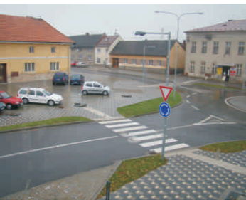
Centrum obce Všechovice

Obnovy se dočkají autobusové zastávky v Opatovicích a v Horním Újezdě, kde na ni dokonce umístí fotovoltaický panel, který přes den nashromáždí energii na večerní osvětlení a elektrické hodiny. V Partutovicích vznikne parkoviště a točna u místního hřbitova, v Teplicích klidová zóna u školky. Hřbitov ve Skaličce, náves v Paršovicích a křižovatku ve Všechovicích čeká obnova zeleně a mobiliáře. Nejvíce peněz však letos směřuje do podnikatelského sektoru, kde se dočká hned 9 záměrů.