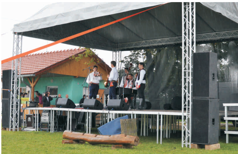
Nové podium zatraktivnilo letošní Den s regionem Hranicko

Dostupnost vybavení bude možno ověřit v přehledném internetovém kalendáři. Na začátku objednávky bude stát Kancelář MAS, technické detaily si pak zájemce dohodne přímo s provozním partnerem. Po Hranicko je již distribuován informační leták, který zájemce seznámí se všemi důležitými informacemi. Plné spuštění systému poskytování vybavení je plánováno na začátek roku 2011. Bližší informace hledejte na webu www.regionhranicko.cz/mobilni-vybaveni .