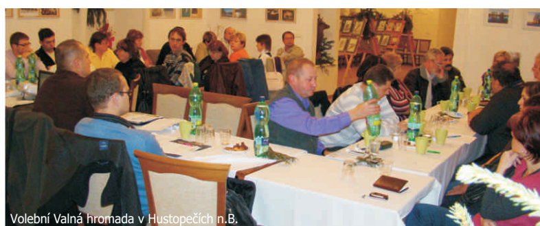
Volební Valná hromada v Hustopečích n.B.