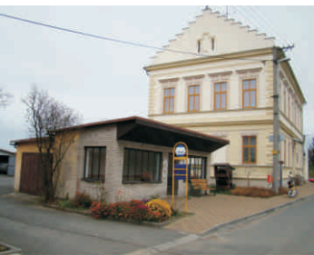
Autobusová zastávka v Horním Újezdě