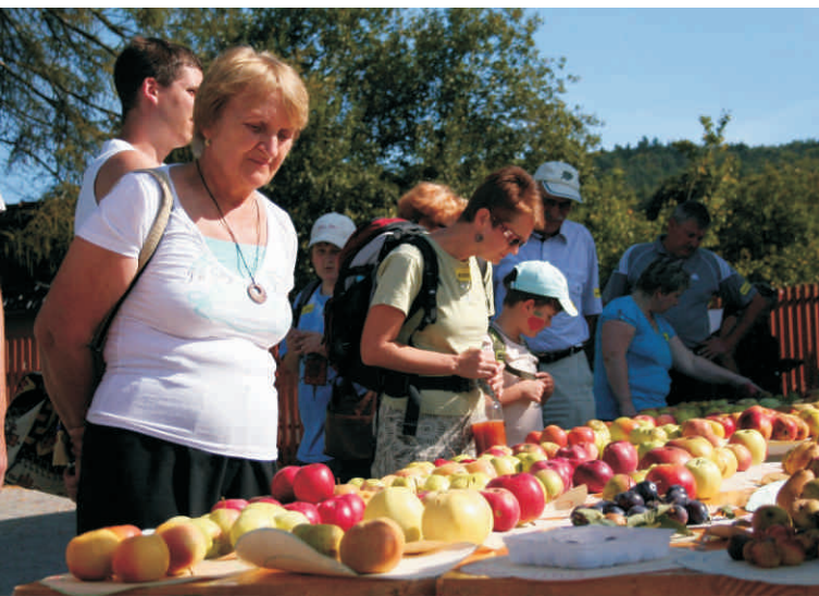
V plánu je uspořádání víkendové akce Ovocné dny

dvoudenní akce s pracovním názvem Ovocné dny, která se pokusí o založení tradice a bude spojením co nejširšího okruhu lidí, organizací, produktů za celý region Hranicko.