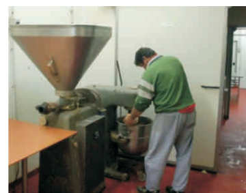
Masná a uzenářská výroba O. Kubeše, Malhotice

A že se koloběh dotačního programu nepřerušil ani na chvíli, to dokazuje aktuální potvrzení výběru projektů z letošní Výzvy, kdy MAS v červnu 2010 doporučila k realizaci rekordních 18 projektů. Po kontrolách koncem října naše rozhodnutí potvrdil SZIF a další sada příjemců se povětšinou hned z jara pustí do realizace. V plánu je proinvestovat až 22 miliónů Kč, téměř 10 miliónů z toho budou tvořit dotace z Programu LEADER.