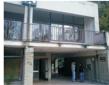
Budova SK Hranice, s.r.o. v areálu lázní