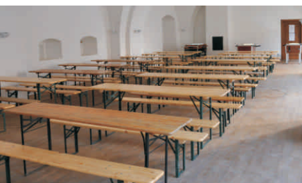
Pořízeno bylo též 20 sad tzv. pivních setů

Dosud nejrozsáhlejší samostatný projekt dokončilo v říjnu 2010 Rozvojové partnerství, během letošního roku pořídilo sadu mobilního vybavení, která bude sloužit pořadatelům nekomerčních kulturních a sportovních akcí na Hranicko. MAS se tak vybavila profipodiem 6x8m, dvěma velkokapacitními stany 6x15m, třemi stany 6x9m, dvěma stanovými podlahami 6x9m, 20 sadami stolů a lavic, 6 jarmarečními stánky, zvukovou aparaturou, dataprojektorem s plátnem a dvěma výčepními zařízeními. V současné době procházíme kontrolou projektu, aby nám mohla být proplacena dotace.