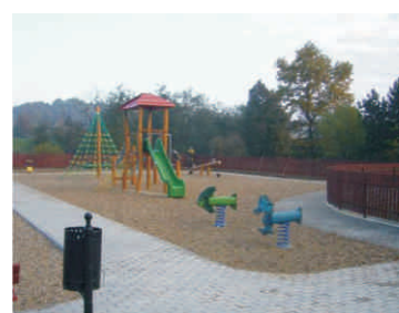
Dětské hřiště v Drahotuších