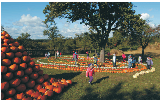
Podzimní festival Prázdniny na venkově

Zastánci rozvoje venkova a výletů či dovolené po venkovských částech republiky mají za svými zády další podporu. V tuzemských regionech se totiž nově rozjíždí projekt s názvem Prázdniny na venkově. Právě Hranicko a Olomoucký kraj je v tomto projektu pilotní. Cílem je vytvořit ucelenou nabídku venkovské zážitkové turistiky v České republice především pro rodiny s dětmi. Do projektu se mohou zapojit jak poskytovatelé ubytovacích služeb, tak venkovští podnikatelé, kteří jsou schopni nabídnout hostům nějakou další činnost, program, místní výrobek nebo ojedinělou dovednost – řemeslníky, zemědělce, včelaře, koňáky, znalce místních tradic a historie a podobně.