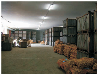
Sklad brambor ZD Partutovice

S blížícím se koncem současného programovacího období Evropské unie 2007 až 2013 se také v těchto měsících rozběhla příprava na další sedmileté období. Českou republiku, vrcholné orgány unie i jednotlivé stavovské organizace čekají dlouhé série jednání, připomínkovaní, navrhování a revidování plánů, jak dále bude zemědělská a dotační politika pokračovat. MASky se samozřejmě zajímají především o budoucnost metody LEADER a právě v této oblasti jsme díky aktivnímu přístupu Národní sítě MAS ČR v čele.