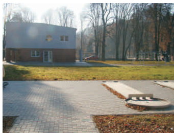
Areál minigolfu SK Hranice

Jako jedni z mála jsme již nyní pro tuto oblast předložili Evropské unii podrobnou představu ukotvenou do dokumentu Národní strategický plán LEADER 2014+ a zdá se, že naše plány mají odezvu jak v Bruselu, tak u jednotlivých národních ministerstev. Metoda LEADER se totiž za krátkou dobu své existence ukázala pro rozvoj venkova jako velmi efektivní směr a v budoucnosti by měla být dále posilována. Především tím, že vstoupí i do dalších oblastí rozvoje a dotačních operačních programů. Za několik let by tak MAS mohly zodpovědně a erudovaně rozhodovat také o určitém objemu dotačních prostředků mířících do vzdělávání, lidských zdrojů či životního prostředí, svůj prostor by také měly dostat při rozdělování prostředků Regionálních