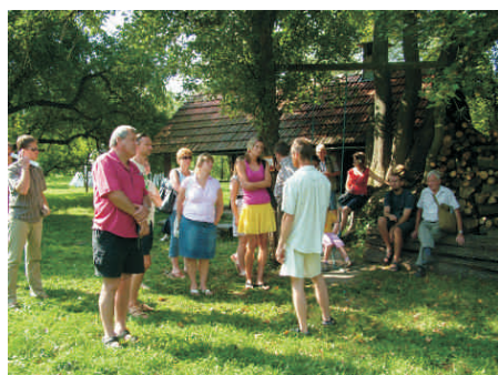
Exkurze ovocnářů v Hostětíně

Všech 7 partnerů projektu společně vydá publikaci, kde se dozvíte zajímavosti opět na téma ovocnářství z různých oblastí Moravy a Slezska.