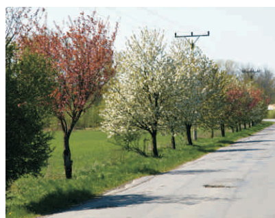
Rozkvetlá alej v Hustopečích n.B.

Výsadba liniové zeleně v obcích mikroregionu Hranicko je prvním ze společných projektů, do kterého se zapojily obce Běloutín, Horní Ujezd, Opatovice, Skalička, Ústí, Stržitež n.L. Zabývá se návrhem výsadby a obnovou krajinných prvků zeleně, zejména liniové výsadby podél komunikací, polních cest