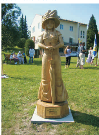
Socha Lázeňské lady v Teplících