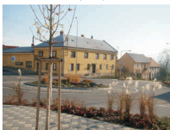
Výsadba zeleně v centru Všechovic

sportovišť, hipostanic a půjčoven sportovního vybavení mohou nově realizovat i obce či neziskové organizace. Pro úplnost dodejme, že v roce 2013 bude ještě jednou naposledy vyhlášena nejžádanější Fiche č.6 Spolkový život a sport.