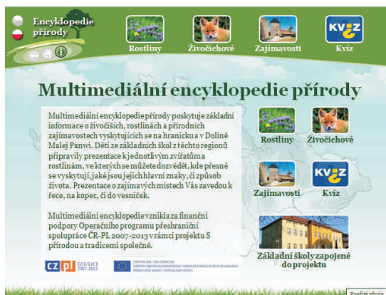
Náhled hlavní strany Multimediální encyklopedie přírody

z hranického regionu i oblasti Doliny Malej Panwi, odkud pocházejí polské školy. Všechny školy do encyklopedie přispěly svými prezentacemi a nyní se z ní stane učební pomůcka pro školy a bude se nadále rozrůstat o další informace.