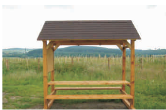
Odpočívka hipostezky na Potštátsku

A tak pokud nedojde k nějakému mimořádnému poklesu zájmu o některou z vyhlášených Fiche, můžeme už teď zájemce informovat o tom, že začátkem března ve Výzvě č. 1/2012 a hned znovu v roce 2013 dostanou šanci zemědělské podnikatelé v rámci Fiche č.1 Rozvoj zemědělských podniků. Nově je zde zařazena možnost nákupu mobilních strojů a MAS se bude během zimy rozhodovat, zda jí využije nebo nadále umožní poskytnutí dotace pouze na budování a rekonstrukce zemědělských staveb, provozů a technologií. Naposledy se na jaře budou moci ucházet obce či neziskové organizace v rámci Fiche č.5 o finanční podporu pro revitalizaci veřejných prostranství, kde mohou nyní bez obav zařadit kromě mobiliáře také různé herní a umělecké prvky. Svou derniéru bude mít rovněž Fiche č.8 umožňující neziskovkám, podnikatelům a nově i obcím budování naučných, turistických či koňských stezek a nově též rozhleden. S pomocí dotace tak např. mohou na Hranicku vzniknout další kilometry hipostezek. Po roční přestávce, za to hned dvakrát za sebou, v roce 2012 i 2013, dostanou příležitost záměry v oblasti cestovního ruchu v rámci Fiche č.7 Podnikání v cestovním ruchu. Také zde došlo ke značnému uvolnění pravidel, u žadatelů padlo omezení maximálně dvouleté historie podnikání v cestovním ruchu a projekty zaměřené na výstavbu a rekonstrukci penzionů,