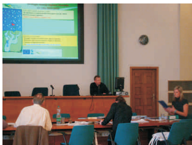
Prezentace MAS na MŽE v Praze

vány jako „nejlépe fungující MAS – příklady dobré praxe, vysoce transparentní a důvěryhodné, aktivní a aktivizující území“. Z celkových 112 hodnocených MAS napříč celou republikou do této kategorie spadá celkem 48 místních akčních skupin.