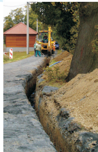
Stavební práce už jsou v plném proudu

Dodavatelem stavby je firma Přemysl Veselý stavební a inženýrská činnost s.r.o. Díky příznivému podzimnímu počasí jsou stavební práce v plném proudu. Věříme, že nás v průběhu stavby nepotkají žádné neřešitelné problémy a že v červnu příštího roku si budou moci občané napustit dobrou kvalitní vodu z kohoutku.