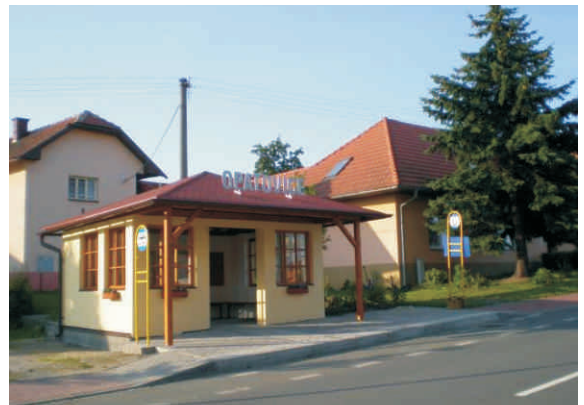
Program LEADER podpořil novou zastávku v Opatovicích