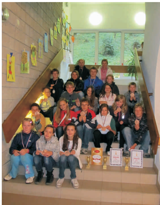
Orientační závod Střítež nad Ludinou: Tým ZŠ Hustopeče nad Bečvou

V sobotu 8. října byl přichystán odlišný program, děti se vydaly poznávat hranický region i jeho okolí. Po prohlídce větrného mlýna v Partutovicích a krátké zastávce u moderních větráků na Veselí byla uspořádána prezentace Multimediální encyklopedie přírody v rodném domě Johanna Gregora Mendela ve Vražném. Dvojjazyčná encyklopedie byla vytvořena na základní škole v Bělotíně a obsahuje velké množství informací o rostlinstvu, živočišstvu a přírodních zajímavostech