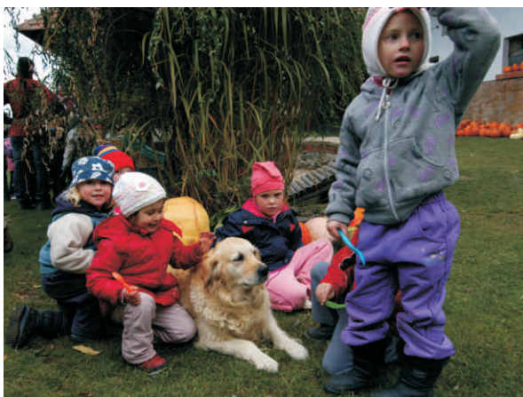
Podzimní festival Prázdniny na venkově

Podnikatelé, kteří se zapojí do Prázdnin na venkově, získají fotodokumentaci svých služeb s texty a jejich překlady do angličtiny, němčiny, francouzštiny a holandštiny, dostupné poradenské služby v oblasti marketingu a interpretace místního dědictví a především možnost propagace na připravovaném novém moderním webu Prázdniny na venkově,