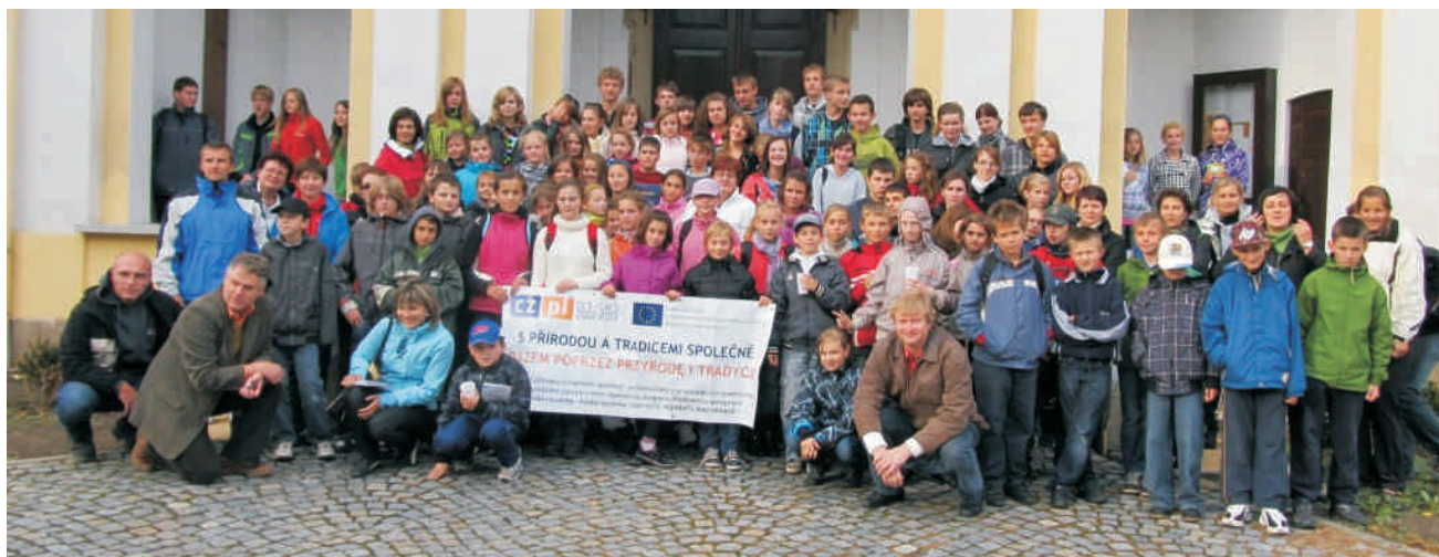
Společná fotografie všech škol zapojených do projektu 8. 10. 2011

Ačkoliv jsou oba partnerské regiony dosti podobné, získaly zapojené strany nové poznatky a nápady, které budou moci využít při nejrůznějších příležitostech v budoucnu. Spolupráci český a polských škol podpořil Operační program přeshraniční spolupráce ČR – PR 2007 – 2013, v rámci kterého je celý projekt realizován.