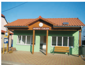
Zastávka v Horním Újezdě