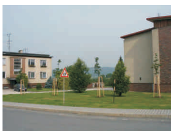
Centrum obce Paršovice