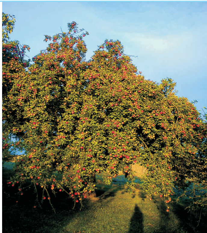
Tato strymka letos urodila 33 pytlů jablek

Celý projekt se propagoval i na několika akcích, z nichž největší byl Farmářský trh v Hranicích. Prezentovali jsme zde svou dosavadní práci, ale sbírali i další nápady a tipy na mapování, měli jsme zde odborníka z Českého zahrádkářského svazu v Přerově, který