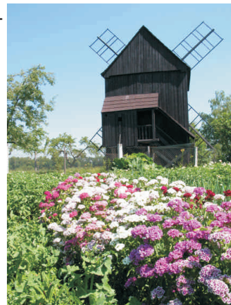
Chlouba obce – Červkův větrný mlýn

tel. Jedná se například o obnovené tradice hodů či kácení máje, v létě zde proběhlo mezinárodní setkání včelařů nebo závod dračích lodí. Příkladná je také péče o místní památky, jako je zvonice či zámek a úzká spolupráce obce s majiteli dřevěného větrného mlýna, ústavem sociální péče Domov Větrný mlýn Skalička či se zemědělci, za což byli ostatně v této soutěži oceněni již minulý rok.