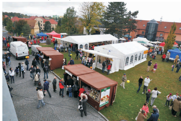
Většina návštěvníků ocenila nové místo konání na prostranství u zámku v Hranicích

gační akce projektu Moravské a slezské ovocné stezky, o které informujeme v jiném článku.