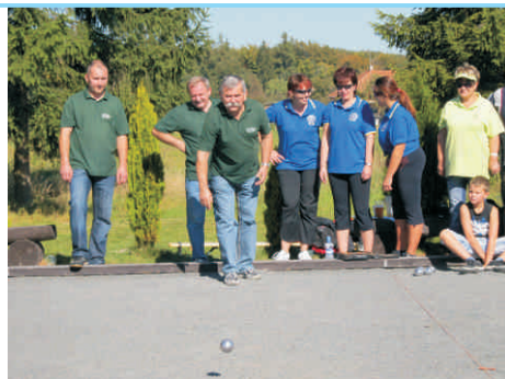
Pétanqueový turnaj o pohár předsedy MR Hranicko

Tuto akci společně připravil Mikroregion Hranicko, Hranická rozvojová agentura a MAS Rozvojové partnerství Regionu Hranicko. Již nyní se na vás těšíme při dalším ročníku v roce 2012!