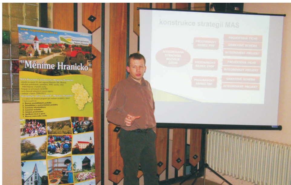
Prezentace přípravy Strategie rozvoje na Valné hromadě MAS v Malhoticích

ných financí, jež by mohly jen pro Hranicko dosahovat až desítek miliónů korun ročně. S tím vším ovšem poroste i zodpovědnost. Už nyní si Národní síť místních akčních