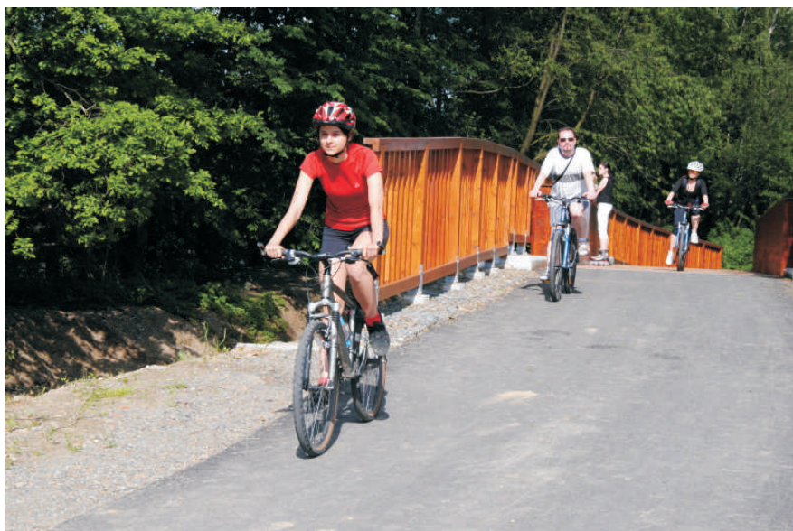
Nový úsek začne sloužit už letos na podzim

Celkový rozpočet projektu je 10 mil. Kč. Realizace proběhne od července do podzimu 2012.