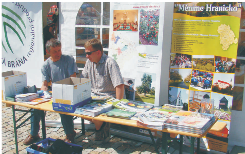
U propagačního stolku na Farmářském trhu

Jak to říct jednoduše: Největší odměnou je spoluvytvářet směřování regionu do budoucna, mít možnost věci ovlivňovat, naučit se přemýšlet v dlouhodobém strategickém horizontu a povýšit společné cíle nad své osobní, či ještě