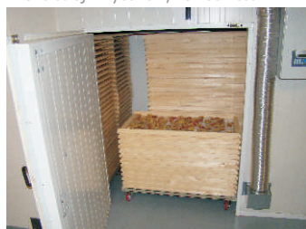
Sušička ovoce, Eduard Kozák