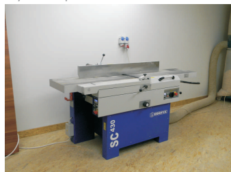
Nové strojní vybavení, Tomáš Lesák