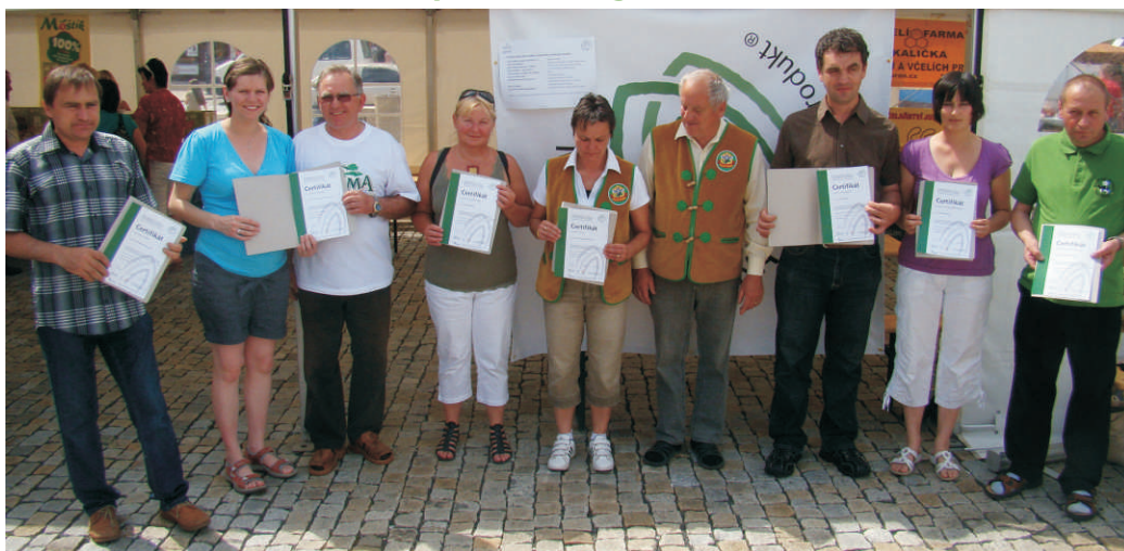
Ocenění výrobci se nechali zvečnit na společné fotografii

II. výzva k udělení značky MORAVSKÁ BRÁNA regionální produkt® bude vyhlášena na podzim tohoto roku. Další informace k regionální značce MORAVSKÁ BRÁNA regionální produkt® naleznete na webových stránkách: http://www.regionhranicko.cz/moravska-brana .