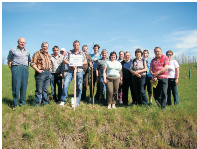
V rámci exkurze jsme vysadili Strom přátelství - moravskou jaderníku

Sada mobilního vybavení pro kulturní a sportovní akce v majetku MAS slouží na Hranicku už třetí sezónu. Profesionální podium, 5 velkokapacitních stanů, 2 stanové podlahy, 6 jarmarečních stánků, 20 pivních setů, zvuková aparatura, dataprojektor a 2 výčepy, to vše bylo s pomocí dotace pořízeno v roce 2010 s cílem poskytovat vybavení pořadatelům nejrůznějších nekomerčních akcí v regionu Hranicko. Zájem o vybavení stále roste, čehož dokladem je naplněný kalendář rezervací veřejně přístupný na webu www.regionhranicko.cz/mobilni-vybaveni . Stále je ovšem možné najít volné termíny a pořadatelé se tak mohou i nadále ozývat manažerovi MAS Františku Kopeckému se svými požadavky.