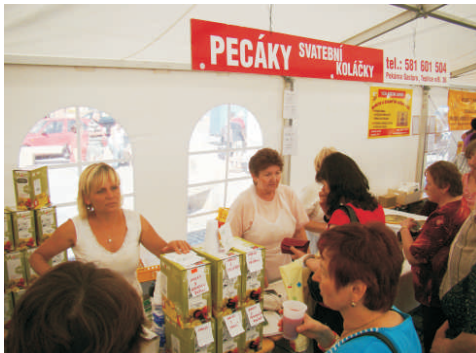
Značka MORAVSKÁ BRÁNA měla svůj speciální stan

V pátek 11. května se uskutečnil v pořadí třetí Farmářský trh regionu Hranicko, který se opět těšil velkému zájmu ze strany prodejců i návštěvníků. Na organizaci této úspěšné akce se podílela vedle hlavního organizátora Živnostenského úřadu v Hranicích také MAS Rozvojové partnerství Regionu Hranicko. Společně zajistili pro návštěvníky nabídku širokého sortimentu řemeslných výrobků a potravin. Místem konání se tentokrát