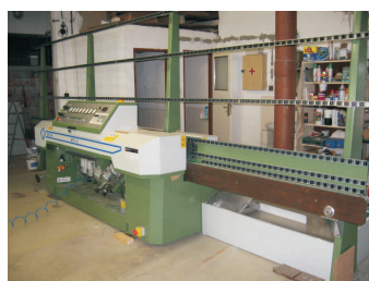
Stroj na broušení skla, Jaromír Vozák

Žadatelé své projekty představili na Veřejném slyšení, které proběhlo 28. května v Hranicích. Projekty nyní procházejí fází hodnocení Výběrové komise, přičemž výsledky budou známy v polovině června.