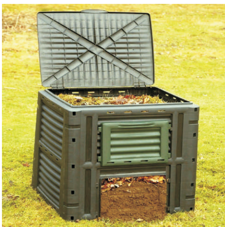
Kompostéry pomáhají výrazně snížit objem odpadu z domácností

I občané obcí Mikroregionu Hranicko si v nejbližší době „sáhnou“ na dotace. Je to sice jen obrazně, ale právě pro ně bude mít největší přínos pořízení kompostérů pro domácnosti. To je totiž další ze společných projektů mikroregionu, do kterého se zapojilo 9 obcí - Hustopeče n. B., Polom, Potštát, Radíkov, Skalička, Střítež n.L., Ústí, Všechnovice, Zámrsky. Projekt byl úspěšně podán v loňském roce, letos jsme udělali výběrové řízení na dodavatele kompostérů. Všechny potřebné podklady byly odeslány k další