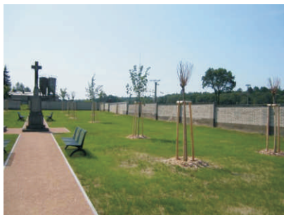
Obnovená zeleň na hřbitově ve Skaličce