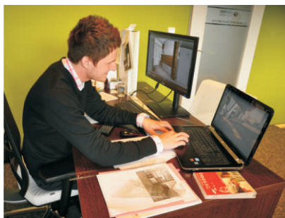
Firmě pana Sargánka už slouží nové počítače