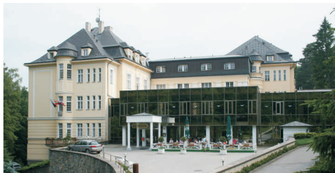
Lázeňský dům Moravan, Teplice nad Bečvou

Pevně věříme, že si všichni tito účastníci odvezou za rok z Hranicka jen ty nejlepší dojmy a budou tak šířit dobré jméno našeho regionu po celé republice.