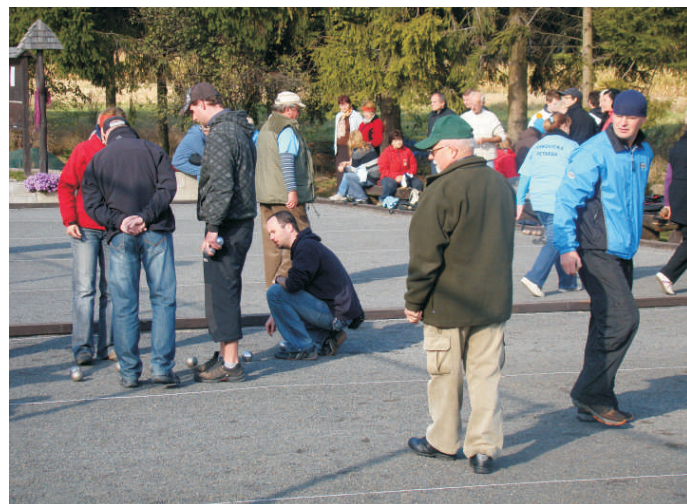
V pétanque rozhodují často pouhé centimetry

Akce se konala za přispění Olomouckého kraje z programu Podpora rozvoje zahraničních vztahů Olomouckého kraje.