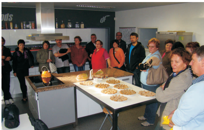
Účastníci navštívili též výrobu „lahůdek ve skle“

navštívu Ruční papírny ve Velkých Losinách, kde jsme byli mile přivítáni místním panem ředitelem a prošli místní muzeum i výrobu ručního papíru, který se také pyšní