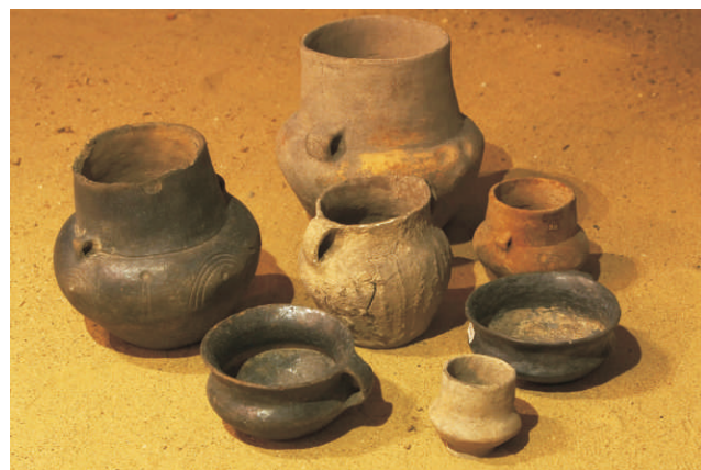
Keramika ze žárových hrobů z Předmostí

Díky projektu Na kole do minulosti Moravskou bránou a Dolinou Malej Panvi se na 70 km dlouhé trase dostanete do různých etap naší minulosti. Putování začíná v Ústí u Hranic. Na zdejších návrší bylo vybudováno hradiště, tzv. Hradištěk. Z jedné strany nepřístupný sráz, z druhé strany důmyslné opevnění zajišťovalo lidem zde žijícím bezpečný život v období od 9. do 12. století. Dále se cyklista vydá po značené trase přes areál lázní Teplice nad Bečvou, nad nimi se tyčí pozůstatky po hradu Svrčov, který zažil dobu své největší slávy v období 14. – 16. století. Další kroky povedou do města Hranice, které se pyšní nádherným historickým centrem, kde se nachází: renesanční zámek, barokní chrám Stětí sv. Jana Křtitele, množství měšťanských domů a další pamětihodnosti. Cyklotrasa dále vede po pravém břehu Bečvy do kopců přes Hrabůvku až do Podhoří. Zde byl od 13. do 15. století budován hrad Drahotuš, na strategickém místě s širokým výhledem do Moravské brány. Nyní zde nalezneme pouze pozůstatky zříceniny hradu. Dalším zastavením je město Lipník nad Bečvou, kde archeologické nálezy dokázaly osídlení již během Velkomoravské říše.