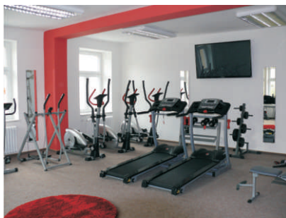
Posilovací stroje v ZEWL HOUSE Běloutín

vhodná skladba zeleně, keřů a stromů. Obec Běloutín do provozu uvedla ZEWL HOUSE, klubové prostory pro místní mládež se zázemím pro pořádání různých akcí, volnočasových aktivit, je zde posilovna, zkušebna s hudebními nástroji nebo moderní audiovizuální technika. Také 2 podpoření podnikatelé už využívají