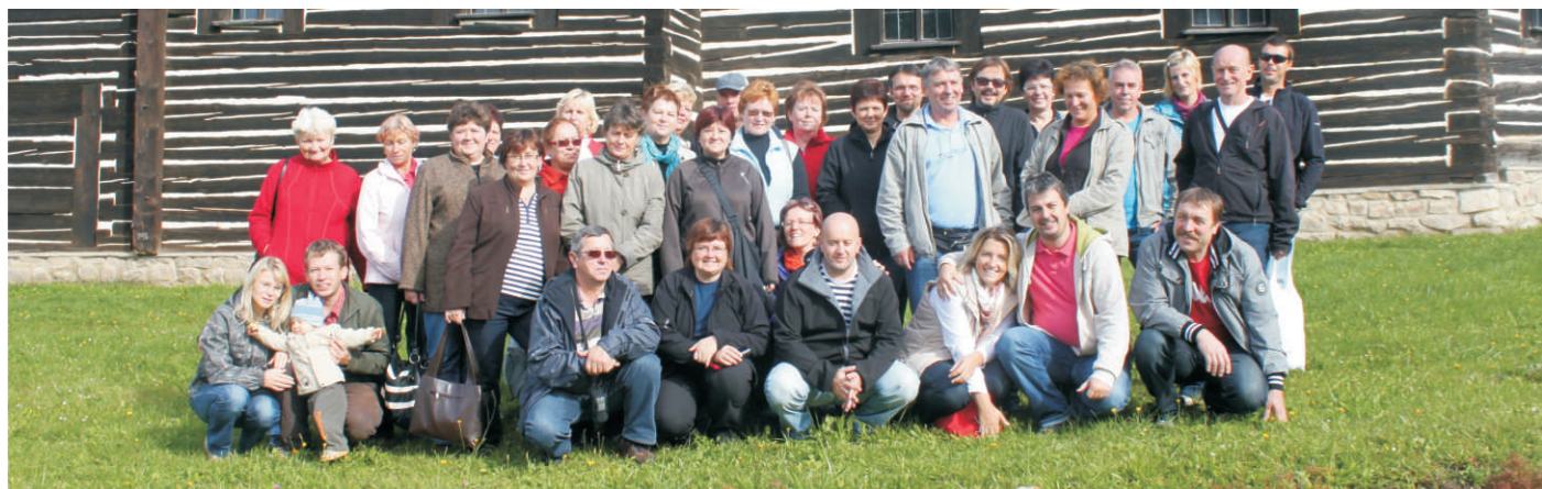
Účastníci studijní cesty v Jeseníkách na společné fotografii

V pátek pro nás zástupkyně MAS Horní Pomoraví připravily