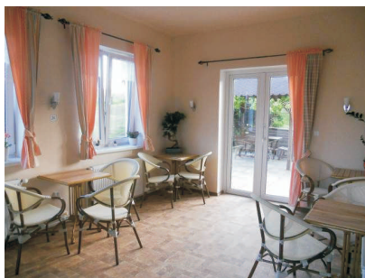
Nové foyer Penzionu Ostravanka

Od posledního vydání Zpravodaje hlásí hotovo také dalších 5 různorodých projektů. Penzion Ostravanka rozšířil a zrekonstruoval vstupní trakt budovy s recepcí a verandou, ve Skaličce byla dokončena revitalizace hřbitova, návštěvníky čeká nový mobiliář, chodníky, parkování, ale také nyní již pro toto místo