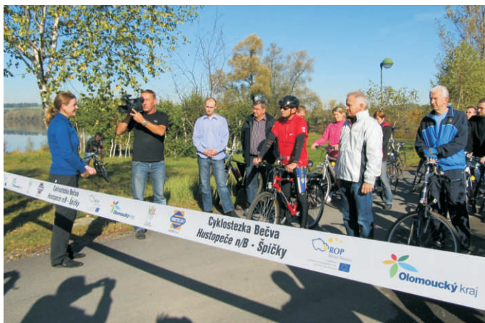
Slavnostní otevření nového úseku Cyklostezky Bečva

pořízení kompostérů financováno vytvoření Studie proveditelnosti přírodě blízkých protipovodňových opatření v mikroregionu Hranicko. V současné době byla dokončena analytická část území, do února roku 2013 se bude zpracovávat návrhová část. Celkové investice jsou 5 milionů Kč.