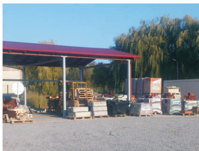
Prodejní sklad v Horním Újezdě