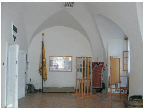
Místnosti potštátského zámku, ideální místo pro expozici

Expozice umístěná na potštátském zámku představí bohatou a zajímavou historii Potštátska - nejen města Potštátu, ale celého okolí včetně místních částí a zaniklých obcí na území vojenského výcvikového prostoru Libavá. Jejím předmětem bude historický příběh Potštátu od dob hrabat Walderode, kteří měli pro Potštátsko velký význam, přes klíčové období 2. světové války, odsunu a dosídlování Sudet, období mezi roky 1948 a 1989 až po konec 20. století. Hlavní zaměření a poselství expozice účastníci komunitního plánování zformulovali takto: Potštát je historická perla uprostřed věnce zelené přírody, který se po válce stal "pahýlem", ale postupně znovu ožívá jako domov nové generace.