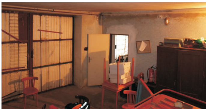
Prostory pro budoucí muzeum Ing. Bohuslava Fuchse

Ve Všechovicích vznikne v nevyužitých obecních prostorách muzeum věnované místnímu rodákovi a významné osobnosti české architektury Ing. Bohuslavu Fuchsovi. Velká část rozpočtu míří do stavebních úprav a rekonstrukcí, poté bude pořízeno vybavení a umístěna samotná expozice, jejíž návrh vytvořili studenti fakulty architektury VUT Brno. Hlavní téma expozice lze charakterizovat takto: Bohuslav Fuchs vyrostl ve skromném kraji, který ho inspiroval svou krásou a vychovával k pracovitosti, houževnatosti a pílí, díky nimž se v životě dokázal prosadit. Bude zde poukázáno na dílo, které ve Všechovicích zanechal. Současně bude expozice ukazovat i další jeho známá díla, jeho úspěchy v oboru a také se pokusí osvětlit principy funkcionalismu laikům. Expozice bude rozdělena do 5 částí: Rodné Všechovice, Neklidná doba studií, Dílo, Funkcionalismus, Život.