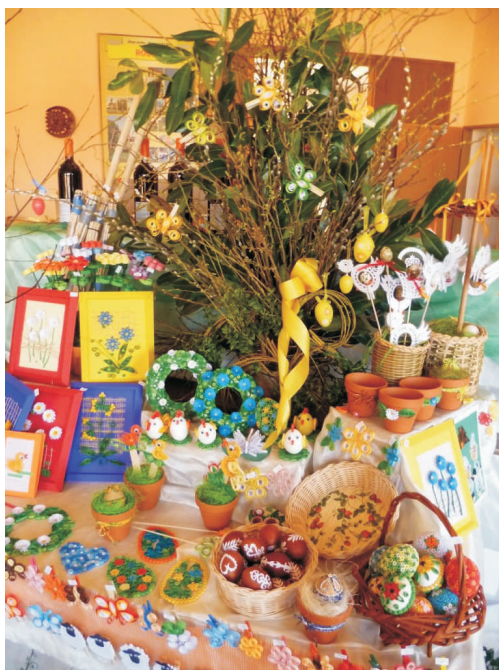
Z velikonoční výstavy v Rouském

Naší snahou je zapojit všechny věkové kategorie včetně dětí, kterým bychom chtěli vštěpit krásu řemesla a tradice, aby tato nová generace ji mohla předávat dál a tím zůstaly staletými zachované tradice i nadále zachovány.