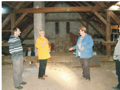
Podkroví bývalé školy v Horním Újezdě

dí, které byly součástí hospodářství nebo sloužily při práci na poli snad v každé chalupě. Brzy se přidaly a velikonocní výstavy s ukázkami řemesel či svátečního prostírání. Nedávno vzešel návrh na další rozšíření expozice do nevyužitého podkroví objektu a během přípravných schůzek také vykrystalizovalo hlavní zaměření rozšířené expozice. Místní cítí dluh vůči mládeži, spoluobčanům i rodákům především v malé informovanosti o významných historických osobnostech, které z obce pocházely či zde působily. Zajímavým zpestřením expozice bude taktéž vybudování vikýře s nádherným výhledem na hostýnské vrchy i vrch Maleník.