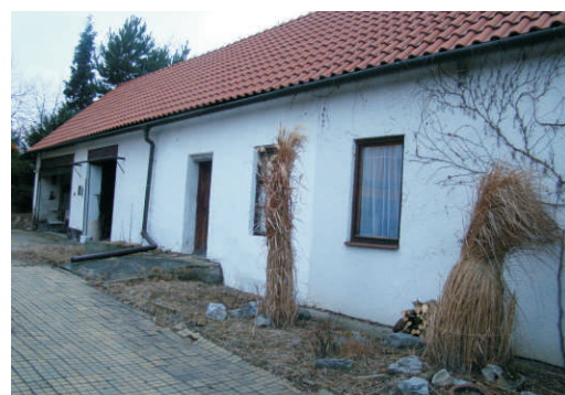
Muzeum námořníka Toma, Skalčička

a připomínky díla, které po sobě zanechal tento významný kněz, myslitel, literát, stavitel kostelů a obětí normalizace, jež působil v Bělotině na přelomu 60. a 70. let.