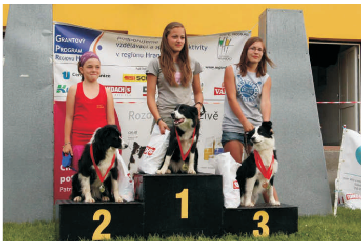
V roce 2013 podpořil Grantový program soutěž v Agility pořádaný Domem dětí a mládeže Hranice

Možnost získat příspěvek má přitom každý organizátor z řad spolků, neziskových a příspěvkových organizací apod., který má dobrý nápad a chuť organizovat společenskou akci. Grantový program bude otevřen v roce 2014, bližší informace o možnosti získání příspěvků z Grantového programu regionu Hranicko jsou k dispozici zájemcům na stránkách www.regionhranicko.cz .