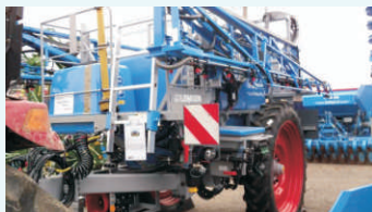
Zemědělská technika ve firmách Statky Potštát a Farma Kozlovský