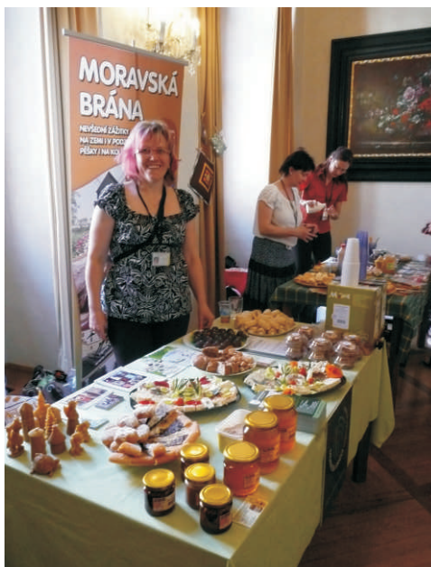
Prezentace regionálních značek v Senátu