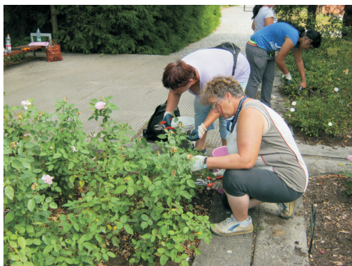
Zaměstnanci pomáhají například s údržbou obecní zeleně

Už téměř u konce je projekt pro nezaměstnané, který Mikroregion Hranicko realizuje od června 2012. Projekt vytvořil 20 pracovních míst pro osoby, které splňovaly specifické podmínky programu Rozvoj lidské zdroje a zaměstnanost, a to zejména, věk nad 50 let, nějaký další způsob znevýhodnění na trhu práce a ohrožení sociálním vyloučením. Největším benefitem pro zapojené osoby bylo získání práce na 19 měsíců. Zaměstnanci si znovu osvojili pracovní návyky a zapojili se tak do běžného pracovního procesu. Jejich činnost je přínosem i pro obce, kde pracují zejména na údržbě a úpravě zeleně a vzhledu obcí. Projekt obsahuje i vzdělávací a motivační aktivity. Každý z účastníků absolvoval motivační program a navazující individuální poradenství, pomáhající s řešením jejich individuálních problémů. Pracovníci měli také možnost získat rekvalifikaci – na práci s motorovou pilou a křovinořezem, údržbu veřejné zeleně, pracovníka v sociálních službách, řidičský průkaz na traktor, či obsluhu vysokozdvizného vozíku. Projekt je financován z Evropského sociálního fondu, částečně přispívají také zapojené obce mikroregionu. Celkové náklady dosahují téměř 6. mil. Kč.