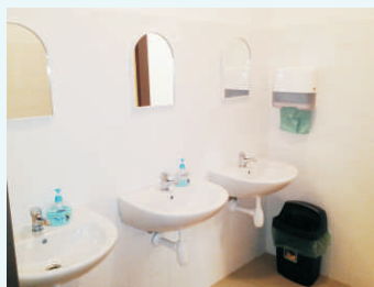
Spravené WC v KD Všechnovice