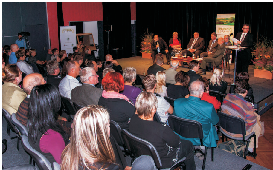
Diskuse o budoucnosti venkova v Divadle Stará střelnice