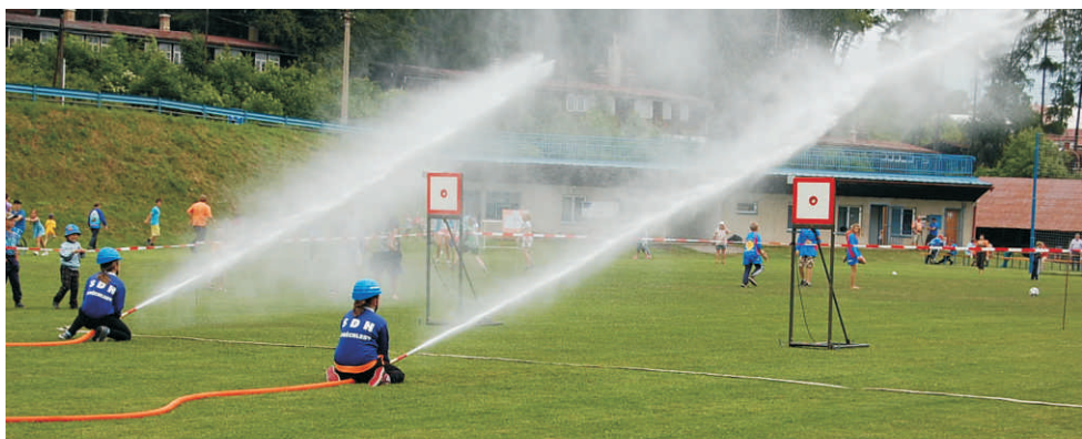
Grantový program podporuje mladé hasiče, v roce 2013 to byli mimo jiné hasiči z Potštátu

Grantový program rozdělil za dobu šesti let své existence mezi organizátory akcí 1. 115. 000 Kč, čímž se významným způsobem zasloužil o rozvoj společenského a kulturního života v obcích regionu. Této úctyhodné sumy bylo dosaženo především díky skvělé spolupráci se zapojenými firmami: Cement Hranice, SSI Schäfer, Váhala a spol. jsou do programu zapojeny od jeho prvopočátků, Tondach Hranice, Hranická rozvojová agentura, Kunst a CS Steel se