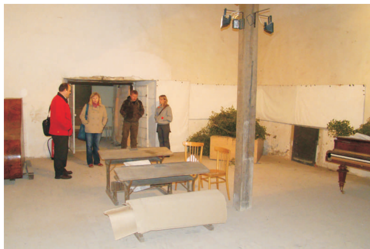
Sál na zámku v Hustopečích, kde vznikne Hudební muzeum regionu Hranicko