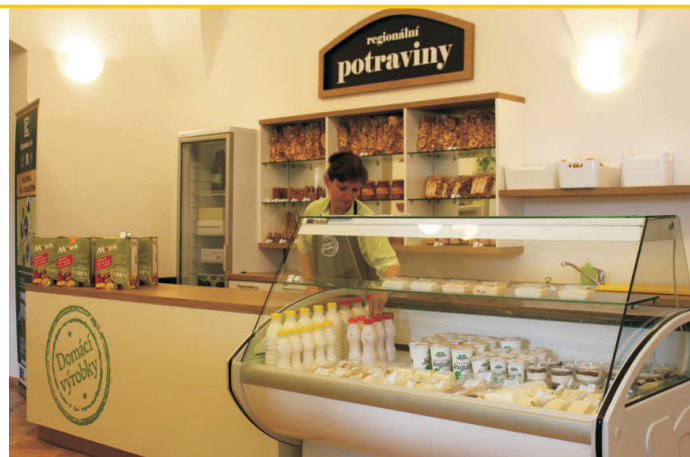
Nová prodejna regionálních produktů na hranickém zámku

Část nákladů byla pokryta z dotací (Významné projekty