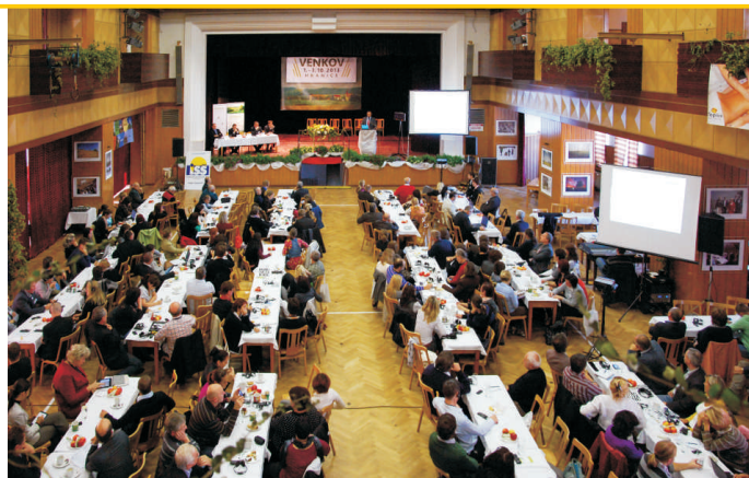
Hlavní část programu hostila hranická Sokolovna