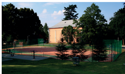
Multifunkční hřiště o.s. Klubko Malhotice