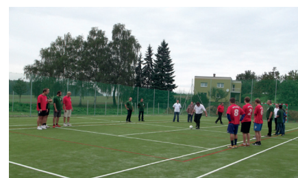
Otevření hřiště v Rouském