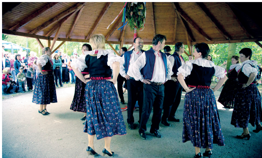
Jednou z podpořených akcí bylo i Kácení máje v Hluzově na konci května