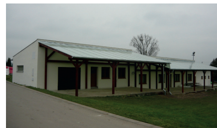
Obnovený areál TJ Býškovice