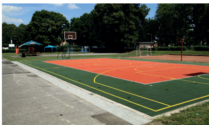
Seřadiště před budovou hranické Sokolovny