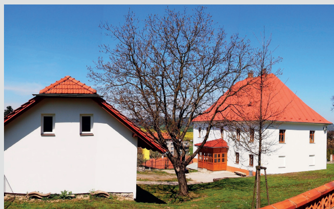
Bělotín, volné prostranství zaplní nové muzeum zemědělství

proutěných košíků apod. Projektem budou vytvořeny významné turistické body s koncentrovanou nabídkou informací o daném regionu. Slavnostní otevření obou expozic je naplánováno na červen 2015. Projekt je podpořen z Fondu mikroprojektů Euroregionu Praděd (součástí Operačního programu Přeshraniční spolupráce Česká republika – Polská republika), celkový rozpočet činí více než přes 350 tisíc EUR, potrvá 14 měsíců s ukončením v srpnu 2015.