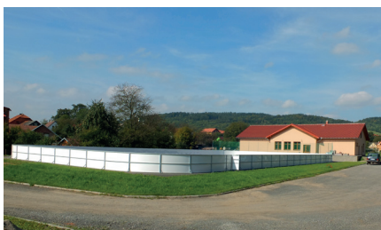
Víceúčelové hřiště ve Strážné n.L.