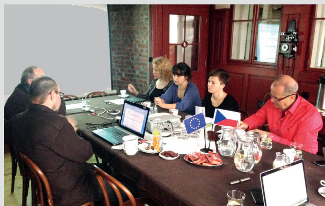
Realizaci projektu zaštiťuje společná česko-polská pracovní skupina

z hlediska cestovního ruchu a nalákání dalších turistů do obou regionů. Díky dostavbě a propojení dálnice D1 a polské části až do Gliwice se zkrátila výrazně dojezdová doba obou regionů, čímž jsou vytvořeny lepší podmínky pro vzájemné návštěvy.