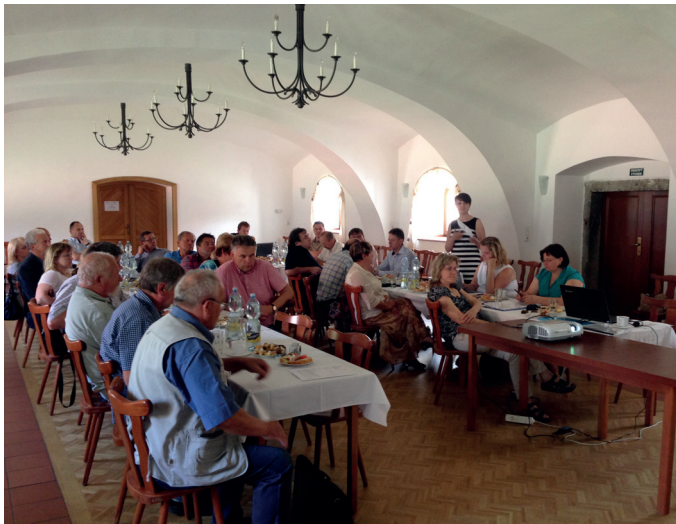
Setkání starostů v Černotíně prohloubilo meziobecní spolupráci