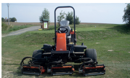
Nová sekačka v areálu Golf Clubu Radíkov