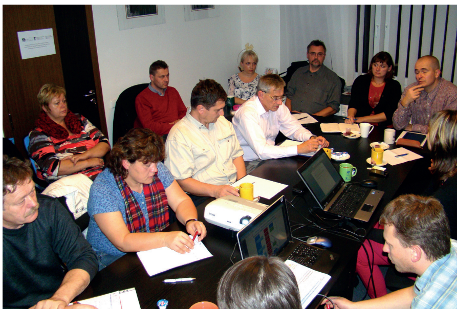
Pracovní skupiny se schází pravidelně už od roku 2013

Analytická část Strategie, která byla dopracována koncem srpna 2014, mapuje a rozebírá území a obyvatelstvo Hranicka z nejrůznějších pohledů. Tato rozsáhlá část strategie je nezbytným základem,