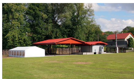
Rekonstruované vyletiště v Kunčicích