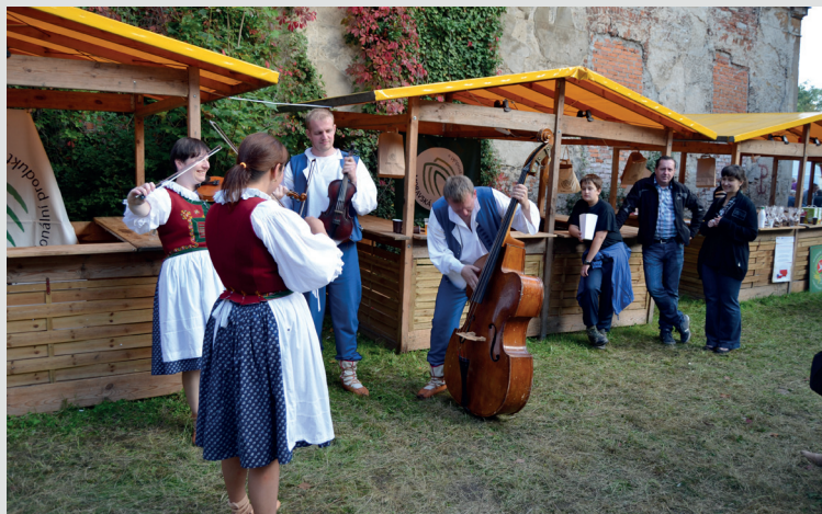
Propagovat Hranicko vyrazila do Polska kromě výrobců i Hudecká muzika

Samotný projekt byl realizován formou dvou výměnných akcí v létě 2014. Na polské straně se zástupci z Mikroregionu Hranicko spolu s výrobcí, držiteli značky, zúčastnili Svátku chmele a chleba, pořádanou v gmině Strzelce Opolskie na konci září. Kromě prezentace výrobků se také vyměňovaly zkušenosti a prohlubovala dosavadní spolupráce. Na oplátku k nám polští výrobci přijeli začátkem října v rámci Farmářského trhu regionu Hranicko v Hranicích. Zde prezentovali jak „variace chuťové“ ochutnávkou svých domácích produktů, tak „variace kulturní“ vystoupením polského souboru BIS, který nám přiblížil polskou kulturu, tradice a folklór. Další aktivitou projektu bylo vytvoření dvou tzv. questů, her připomínajících honbu za pokladem. První quest, s názvem Dobroty Mo-