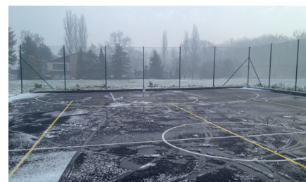
Asfaltové hřiště TJ Tatra Všechnovice