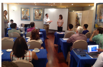
ERASMUS – zahajovací setkání k projektu E-ONE ve španělské Málaze