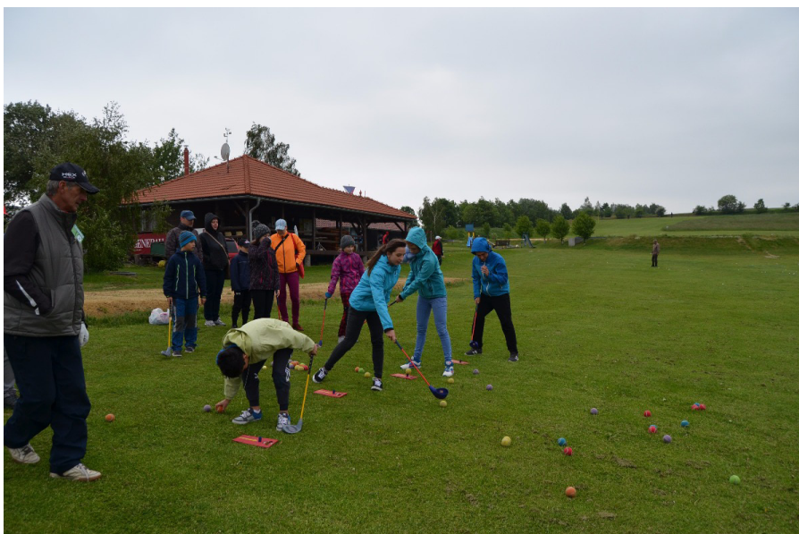
Novým golfovým dovednostem se učily i děti

Navzdory nevlídnému počasí se v sobotu 23. 5. uskutečnila na radíkovském golfovém hřišti akce „Den s regionem Hranicko“. Hranické rozvojové organizace ve spolupráci s Golf Clubem Radíkov přichystaly pro návštěvníky bohatý sportovně-kulturní program, který však musel být pořadateli nakonec omezen. Velmi silný a studený vítr neumožnil postavit velkokapacitní stav, zrušena musela být některá vystoupení a čekalo se, zda a kolik odvážlivců se objeví. Úderem deváté hodiny se na místo začali sjíždět první návštěvníci, na které už byli připraveni členové golfového klubu, kteří jsou již na místní občas drsné podmínky adaptováni. Nově přichází se ihned