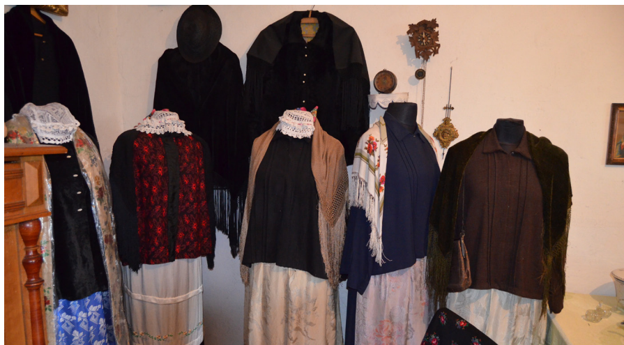
Ukázka tradičních oděvů ve stávající části muzea v Kolonowskie

EVROPSKÁ UNIE EVROPSKÝ FOND PRO REGIONÁLNÍ ROZVOJ PŘEKRAČUJEME HRANICE