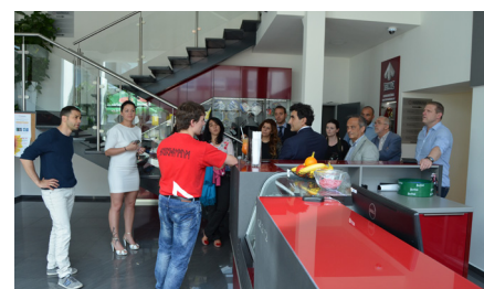
Setkání partnerů projektu EGPIs v Hranicích, návštěva sportovního centra NAPARIA