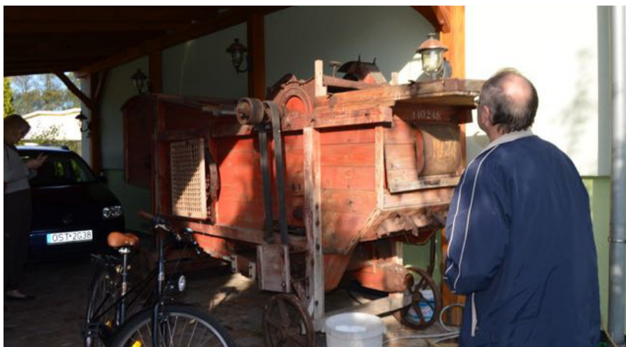
Invetarizace exponátů pro nové muzeum v Kolonowskie

Druhý projekt je podpořen z tzv. Fondu mikroprojektů a už samotný název projektu Děti dětem napovídá, že vše se bude točit kolem dětí. Myšlenkou projektu je propojení českých a polských dětí v průběhu dvou týdnů na letním pobytovém táboře. Týden stráví děti v Čechách a týden v Polsku. Program obou táborů je zaměřený na poznávání tradic a kultury obou regionů, sociální integraci, prohloubení si sportovních dovedností, environmentálních znalostí. Na české straně je do projektu zapojen Dětský domov v Hranicích, který na tábor vyšle 20 dětí ve věku od 5 do 17 let, na polské straně to jsou děti z obce Kolonowskie ve věku 8–16 let. Projekt bude ukončen již na konci července.