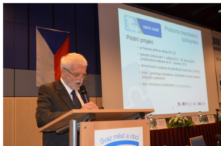
Jednání o projektu probíhá po celé republice

zdal realizační tým finální podobu tzv. Souhrnného dokumentu. Strategický dokument s více než 300 stranami přináší skutečně podrobnou analýzu zmiňovaných oblastí v celém ORP Hranice (region), problémové okruhy a návrhy na