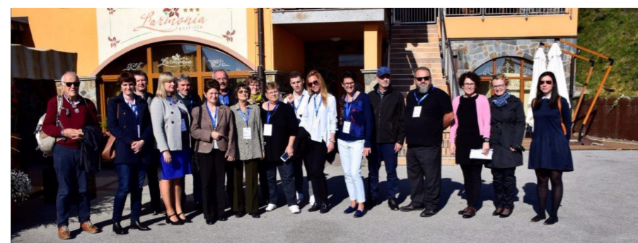
Projekt ENSuRE svedl účastníky na první setkání do Slovinska