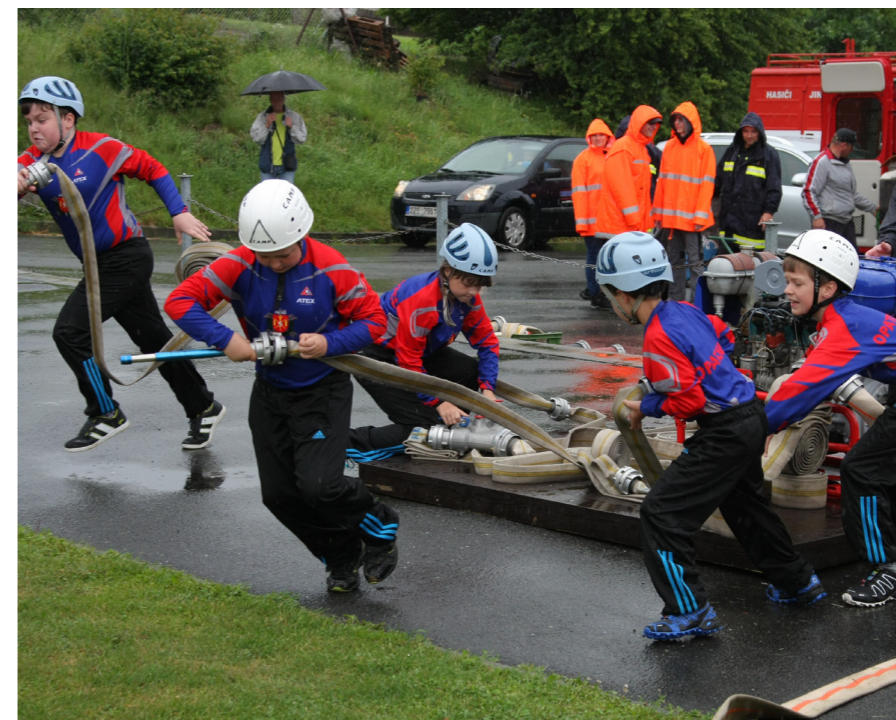
Grantový program letos mj. podpořil ↑ žákovskou hasičskou soutěž v Opatovicích, přehlídku trofejí v Hustopečích n.B. → a aktivity děti ve Všechnovicích ↓