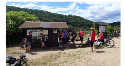
↑ Starostové sbírali inspirace na bicyklech