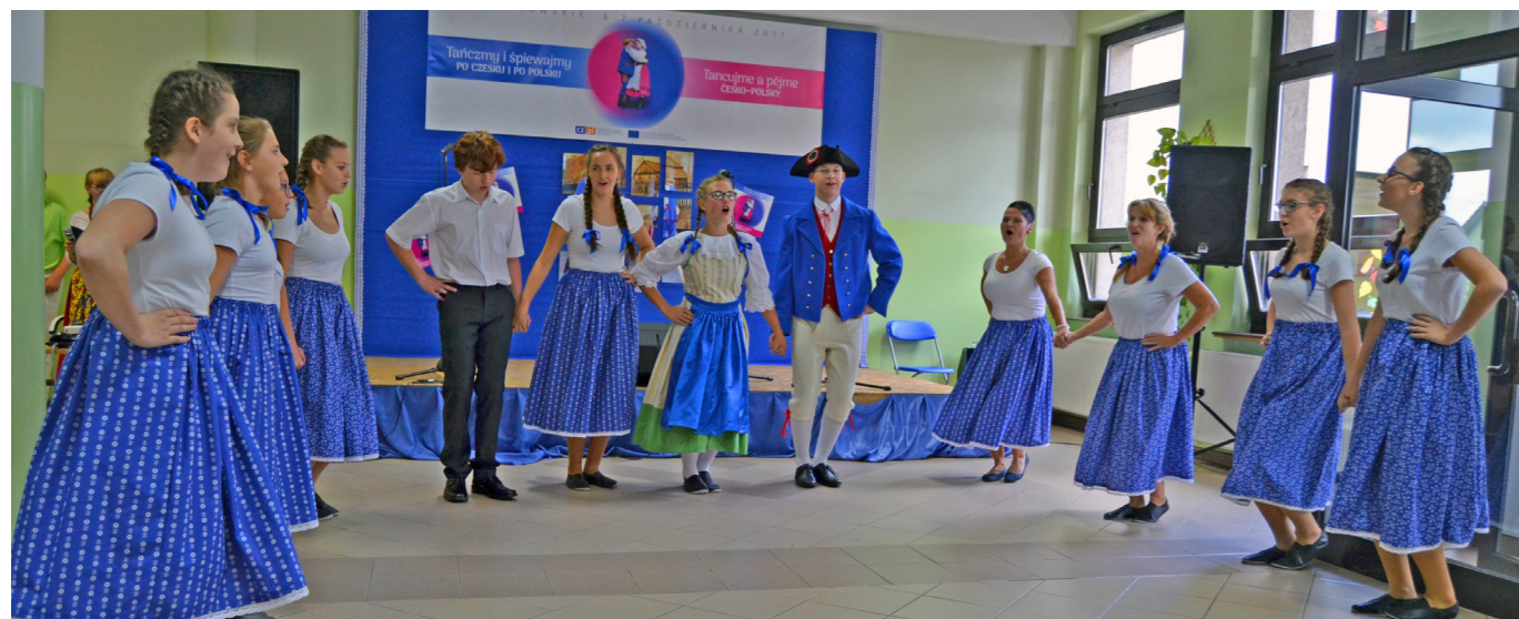
Děti i paní učitelky z Hranicka předstávají polským kamarádům moravské písně i kroje.