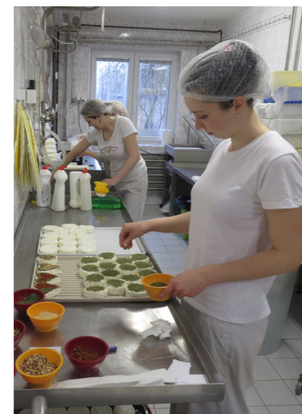
Dotace opět podpoří místní výrobu potravin

Kolektiv tvoří maximálně 24 dětí, většinou se ale jedná o menší věkově smíšené skupinky do max. 12 dětí, o které se starají obvykle dvě pečující osoby. Ty musí splňovat odbornou kvalifikaci danou zákonem, jedná se především o pedagogické, sociální či zdravotnické profese. Zařízení musí být otevřeno všechny pracovní dny v týdnu alespoň 6 hodin denně. Délka umístění dítěte v dětské skupině záleží na dohodě mezi rodičem a poskytovatelem služby.