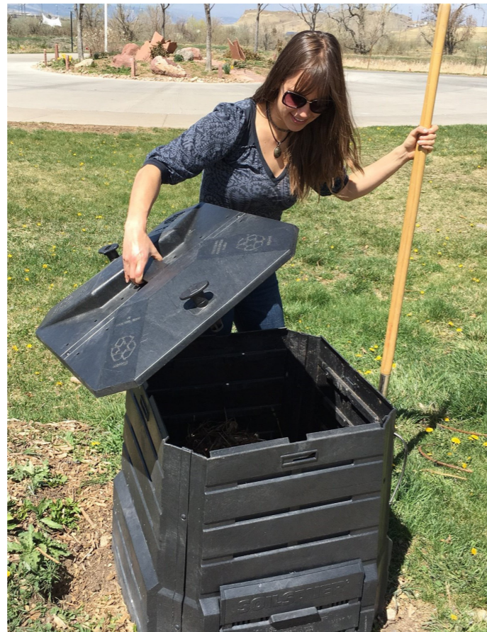
Mikroregion zajistil domácnostem na Hranicku už více než 2500 kompostérů →