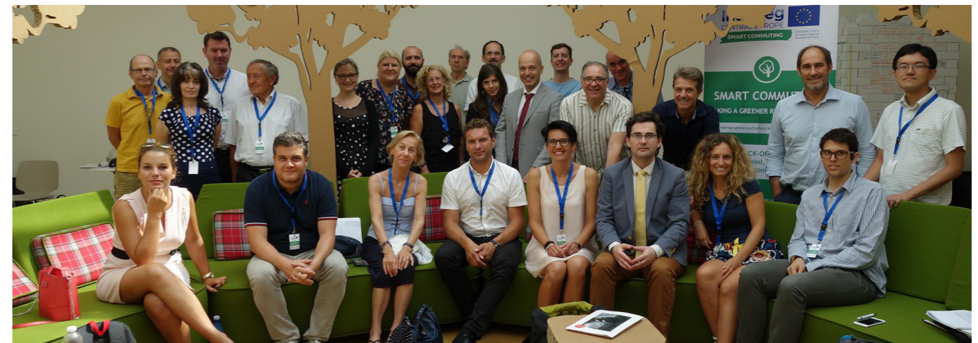
Plán udržitelné mobility pro město Hranice vznikne v rámci mezinárodního projektu, více na str. 6