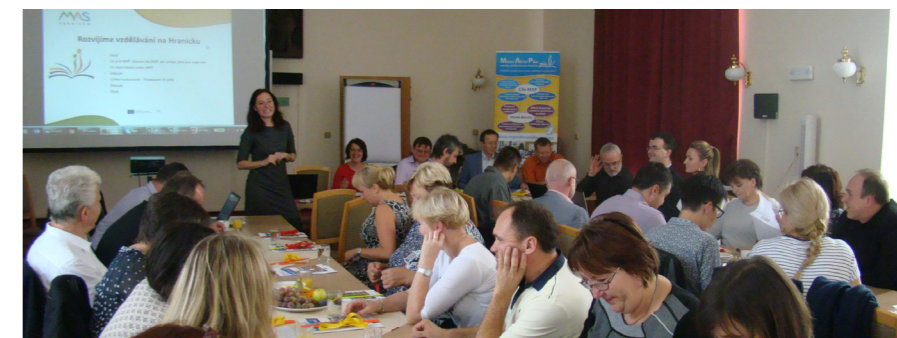
Projekt MAP završilo důležité setkání ředitelů a starostů

Výzva na podávání projektů MAP II. běží od poloviny listopadu, realizace pak může být volitelně tříletá nebo čtyřletá s plánovaným startem v září 2018. Prostředky v objemu až 13 milionů Kč budou využity na podporu a provádění aktivit naznačených v MAP I. stejně jako na další prohloubení strategického plánování a vytvoření akčních plánů na roky 2019 až 2022. Otevírá se nám tak cesta, kterou jsme si na Hranicku zhmotnili do 3 pilířů.