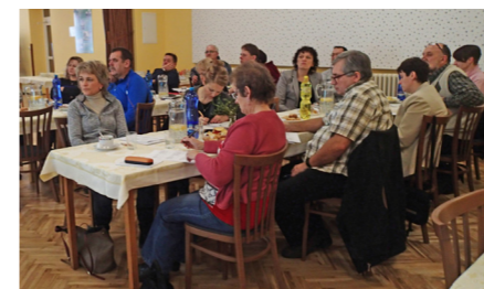
CSS pořádá školení pro starosty

Za dotační podpory z Operačního programu Interreg V-A Česká republika – Polsko spolupracují české a polské školy při organizaci aktivit z různých oblastí lidského života a seznamují se s tradicemi sousedního státu. Jedná se o čtyři oblasti – poznávání tradic a zvyků, místní kultury, gastronomie a sportu. Všechny tyto oblasti prozkoumají žáci i učitelé prostřednictvím realizace zajímavých aktivit od března 2017 do října 2018.