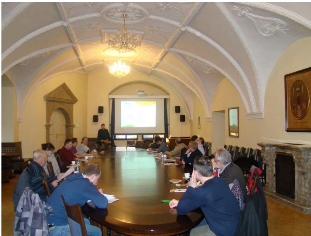
Závěrečná veřejná prezentace aktuálního stavu a debata k SCLLD regionu Hranicko 2014-2020 v Hranicích 4.2.2016