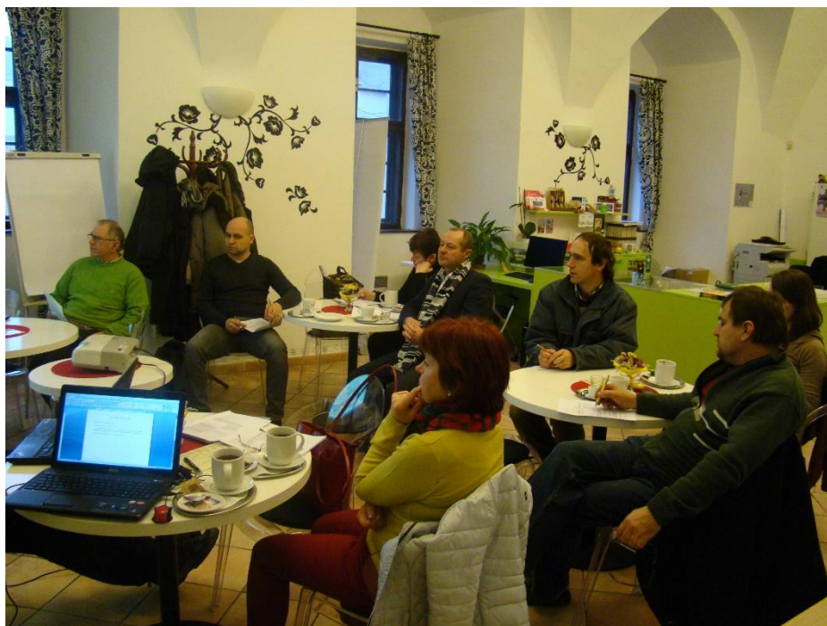
Jednání pracovní skupiny Ekonomický rozvoj k SCLLD 26.1.2016