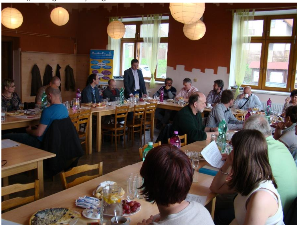
Zasedání Valné hromady MAS Hranicko v Partutovicích 19.4.2016