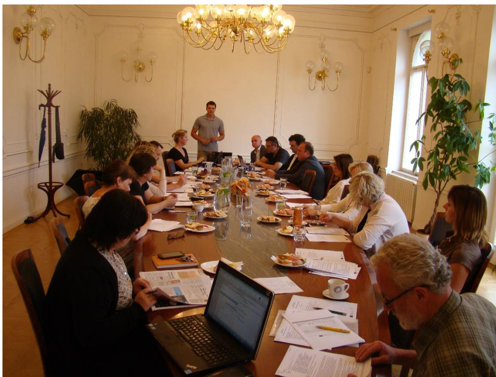
Jednání Řídícího výboru projektu MAP pro Hranicko v Hranicích 15.6.2016