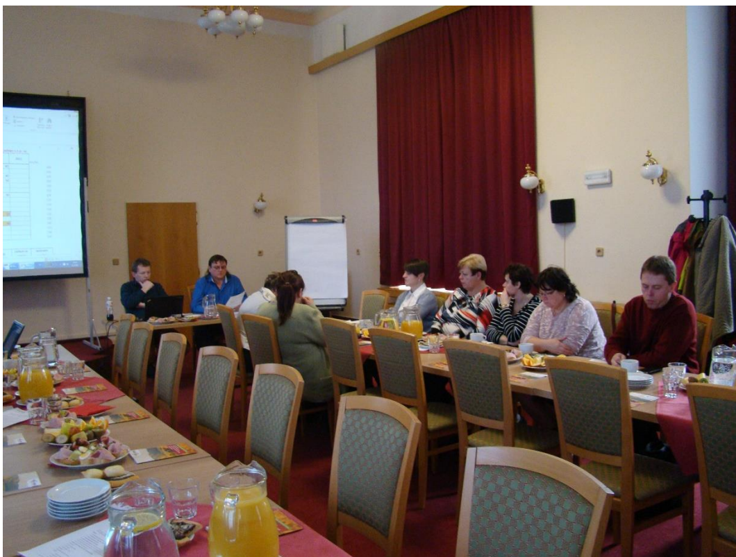
Jednání Výboru MAS Hranicko v Lázních Teplice na Bečvou 9.2.2016