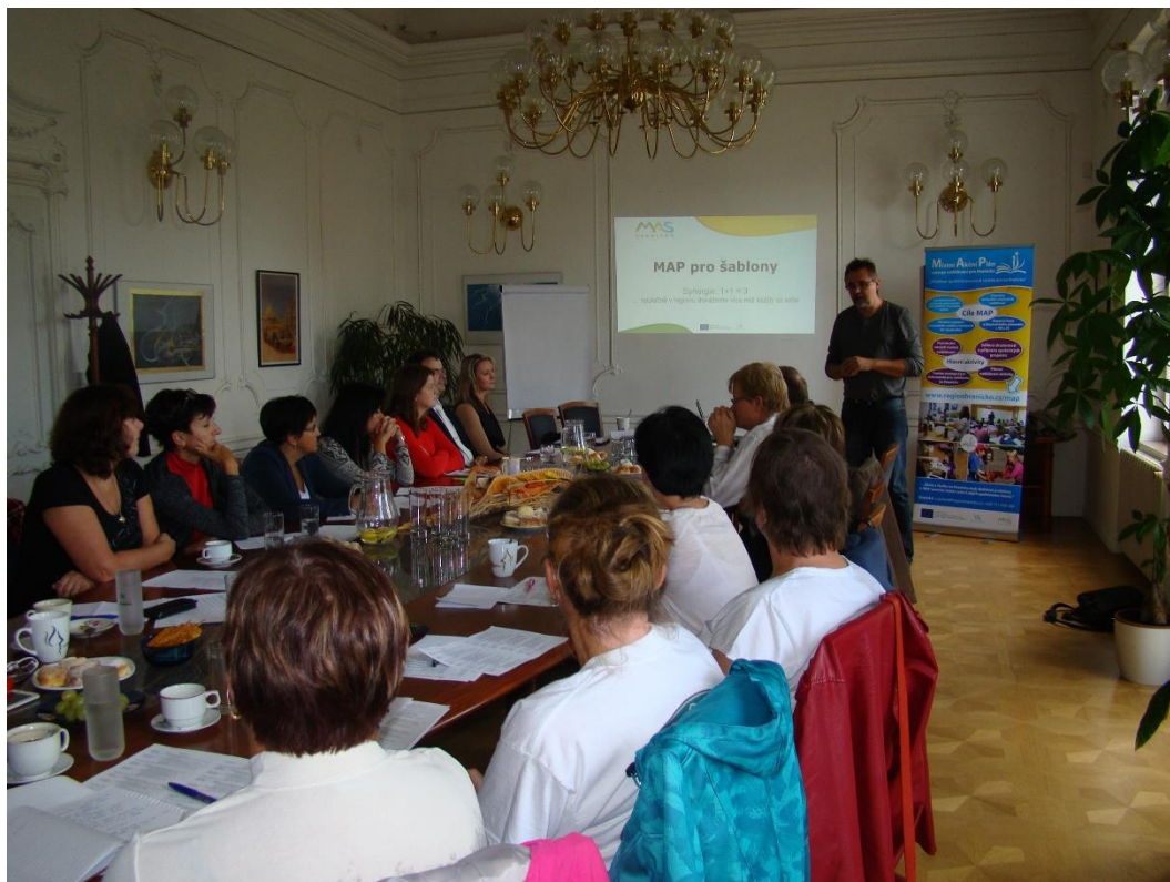
Setkání Mateřských škol k šablonám v Hranicích 22.9.2016