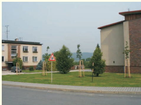
Veřejné prostranství v Paršovicích