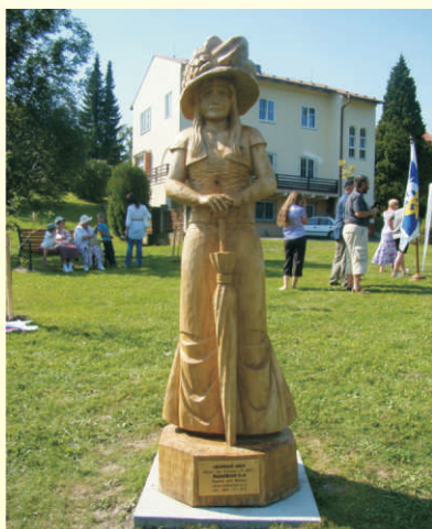
Klidová zóna se zelení a sochou, Teplice n.B.