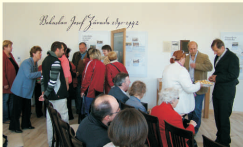
Otevření muzea v Býškovících