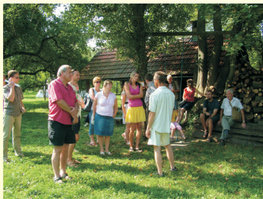
Seminář o ovocnářství v Hostětíně

Zajímavou inovací bude aplikace REG-TIME, která využívá technologie GPS v mobilních telefonech. Zájemce při pohybu v krajině může skrz mobilní telefon dostávat textové či hlasové informace o zajímavém sadu či aleji, ke které zrovna dorazil. Projekt a dílčí aktivity byly během září až listopadu prezentovány na 5 lokálních akcích v regionu, jako byly různé trhy, výstavy či košty. Největší akcí byl Den pro ovoce v rámci Farmářského trhu regionu Hranicko dne 8.10. (více viz