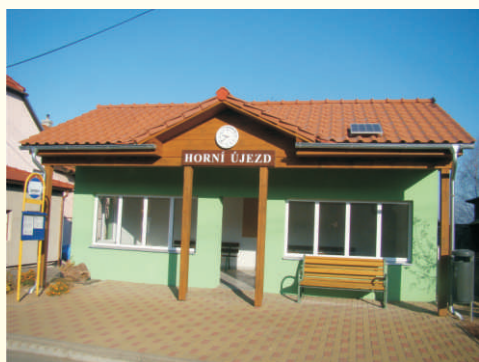
Nová autobusová zastávka, Horní Újezd