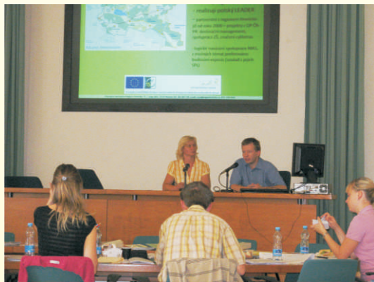
Obhajoba Projektu Spolupráce před hodnotitelskou komisí v Praze

V roce 2010 byl spolu s MAS Mohelnicko připraven další společný projekt na budování venkovských muzeí, který ale v tehdejší výzvě v silné konkurenci až šestinásobného převisu zájmu neuspěl. Obě MAS během podzimu 2010 nabídky projekt ke společné realizaci polské LGD Kraina Dinozaurów. Ta působí na území gmin Kolonowskie a Zawadzkie, s nimiž region poutají už dva společné projekty v rámci Operačního programu Přeshraniční spolupráce Česko – Polsko. Společnou přípravou vznikl projekt Moravsko-polské cesty tradic a poznání, který byl v rámci 13. kola PRV dne 27.6.2011 zaregistrován na CP SZIF v Praze. 18.8. 2011 se pak zástupci obou moravských MAS zúčastnili obhajob projektů Spolupráce před hodnotící komisí v Praze. Bohužel 7.9. 2011 nám oznámili polští partneři, že jejich verze projektu nebyla schválena polským řídicím orgánem, naopak na české straně nám bylo dne 25.10. 2011 českým řídicím orgánem oznámeno schválení projektu k realizaci a získání dotace.