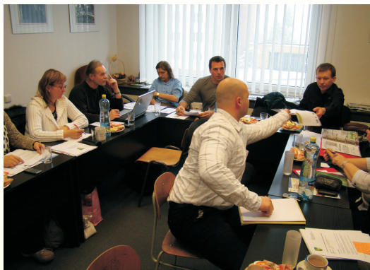
Jednání Pracovní skupiny Hodnocení MAS v Hranicích