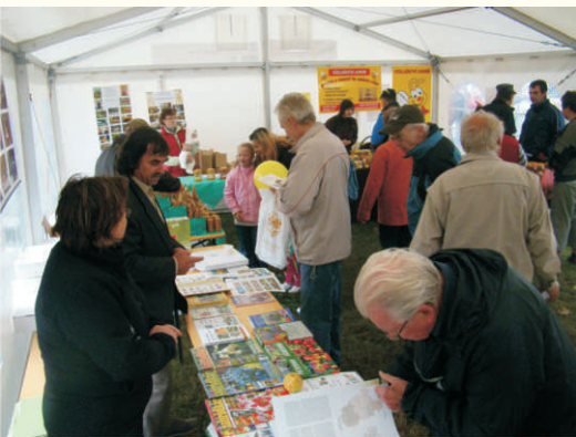
Den pro ovoce v rámci Farmářského trhu

Velkým okruhem aktivit je propagace ovocnářství. Kromě výpravné publikace a hracího kvarteta, které vzniknou v roce 2012 se jedná o různé letáčky, plakáty a panely.