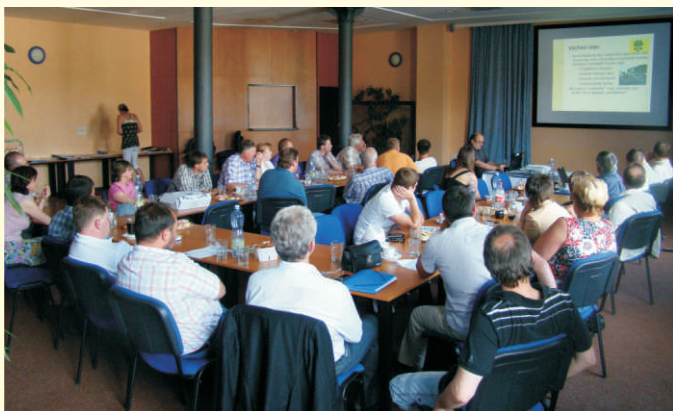
Veřejné slyšení žadatelů se těšilo hojně účasti

31. května taktéž proběhlo již tradiční Veřejné slyšení žadatelů, zde se hodnotitelé i široká veřejnost mohli seznámit se všemi 23 hodnocenými Žádostmi a položit doplňující dotazy. Jednotliví členové Výběrové komise pak vyhodnotili podané Žádosti a přiřadili jim počet bodů dle naplnění jednotlivých preferenčních kritérií v souladu s Metodickým pokynem pro hod-