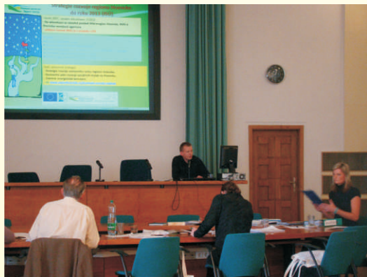
Obhajoba MAS v rámci procesu Hodnocení MAS 2011

V roce 2011 proběhl ze strany MZE, SZIFu a Národní sítě MAS už podruhé proces hodnocení všech 112 MAS v ČR, které se účastní dotačního programu LEADER. Hodnocení probíhalo formou vyplnění obsáhlého dotazníku a následně obhajoby před hodnotící komisí v Praze. Kromě zpětné vazby bylo pro nás toto hodnocení důležité ve stanovení tzv. „finančních bonusů“ na alokaci pro rok 2012, zajímavé je též srovnání zisku bodů v obou kolech a tím zachycení „vývoje“ naší MAS.