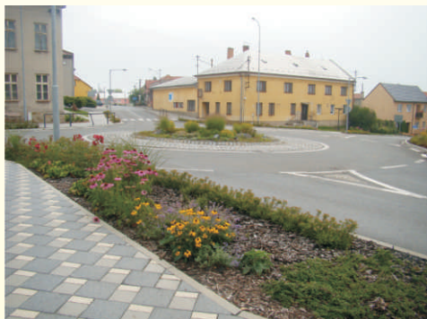
Výsadba zeleně v centru Všechovic