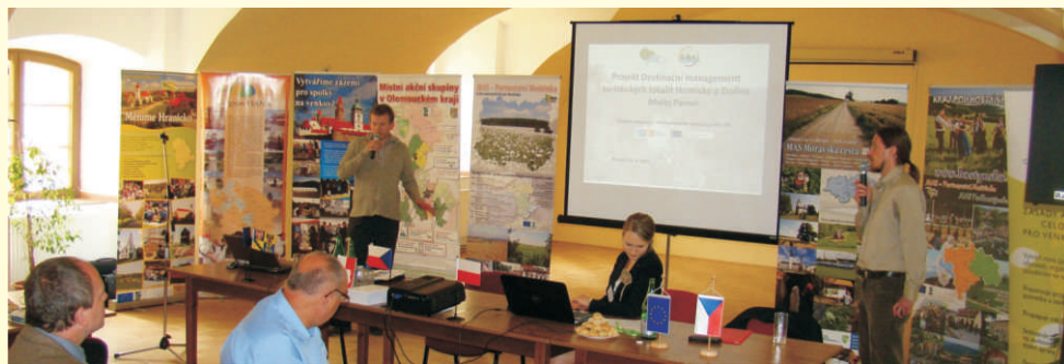
Prezentace česko-polských projektů z regionu Hranicko

Česko-polská konference, jíž se kromě zástupců naší MAS zúčastnila i partnerská LGD Kraina Dinozaurów z Polska.