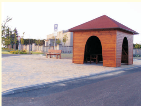
Veřejné prostranství u hřbitova, Partutovice