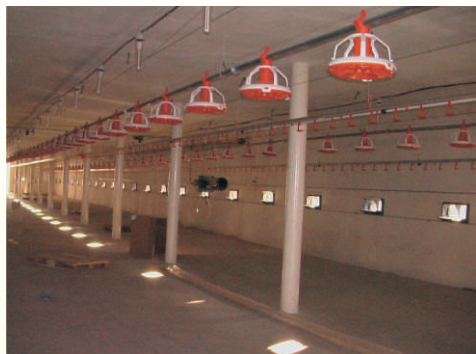
Hala pro výkrm drůbeže na farmě Aloise Ondrouška