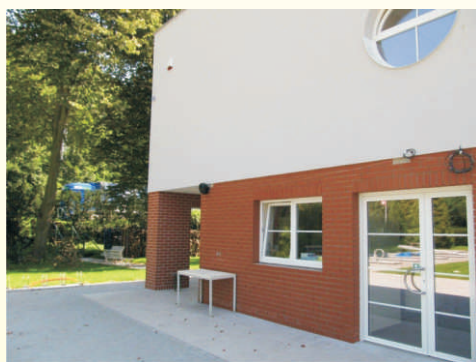
Rekonstrukce areálu a budovy Sportovního klubu Hranice s.r.o. v areálu lázní