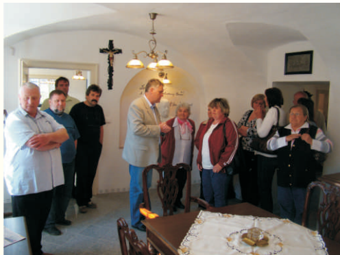
Starosta Bělotína provádí hosty expozici

V průběhu roku 2011 probíhala realizace společného projektu Spolupráce s MAS Mohelnicko, která se taktéž ujala role KMAS. Cílem projektu s rozpočtem 4.922.159 Kč (z toho MAS Hranicko 2.244.059 Kč) bylo vybudování celkem 4 stálých expozic v partnerských regionech, z čehož dvě se nachází na Hranicku, konkrétně v Býškovících a Bělotině. Během zimy a jara 2011 probíhaly stavební práce, nákup vybavení a postupně naplňování muzeí exponáty. Dále byly vytvořeny internetové stránky www.regionhranicko.cz/muzea a propagační leták.