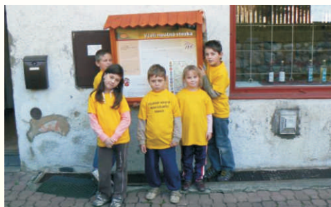
Úvodní zastavení Včelí naučné stezky