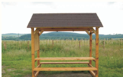
Odpočívka u Hipostecky na Potštátsku