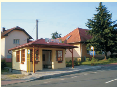
Nová autobusová zastávka v Opatovicích