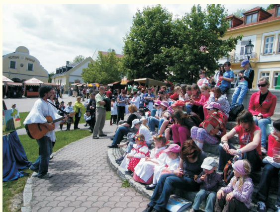
Vystoupení Divadla Tillia