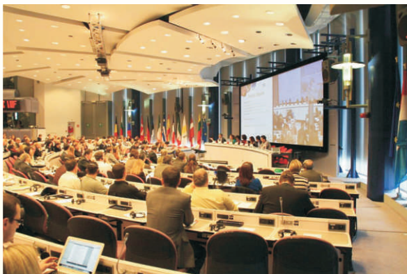
Hlavní zasedací sál workshopu v Bruselu

řadala v areálu Evropské komise Evropská síť pro rozvoj venkova. Cílem setkání zástupců MAS bylo oživit rozměr LEADERu pro nové, méně zkušené MAS z celé Evropy. Současně šlo o zvýšení povědomí o strategické roli Leaderu pro rozvoj venkova a usnadnit zástupcům MAS výměnu zkušeností a praxe. Program byl zaměřen na předání zkušeností při realizaci programu Leader, efektivní realizaci strategií místního rozvoje a nejlepší praxi v oblasti mezinárodní spolupráce. Akce se zúčastnilo okolo 350 zástupců MAS z celé Evropské unie. Českou republiku reprezentovalo 15 zástupců místních akčních skupin.