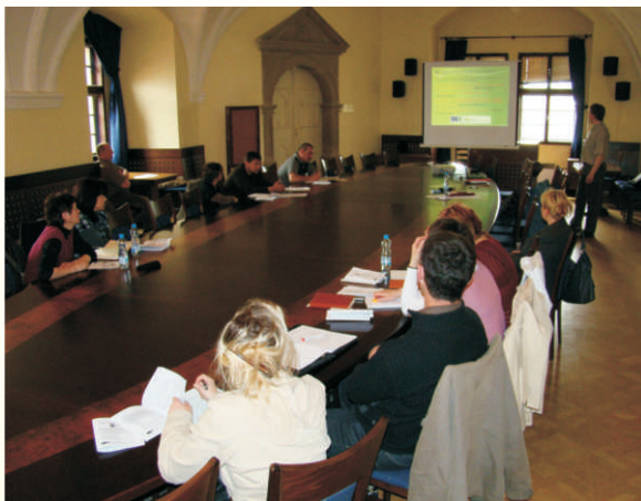
Informační seminář pro žadatele

rovněž připravila pro každou Fichi zvlášť podrobnou Příručku pro žadatele k Výzvě č.1/2011, která prováděla žadatele všemi úskalími přípravy Žádosti o dotaci. Manažeři MAS během trvání Výzvy poskytli 15 osobních a množství telefonických a emailových konzultací. Pro zájemce byl také dne 11. dubna uspořádán v Hranicích Informační seminář pro žadatele, kterého se zúčastnilo celkem 13 zájemců. V rámci Výzvy č.1/2011 bylo podáno 26 žádostí, 3 žádostem byla ukončena administrace (podrobnosti viz níže).