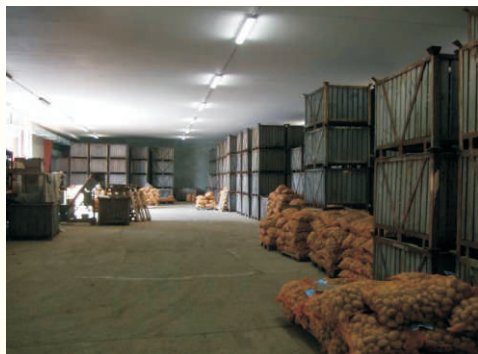
Sklad brambor v ZD Partutovice