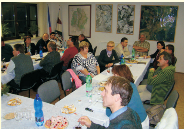
Prosincová Valná hromada MAS ve Stříteži n.L.