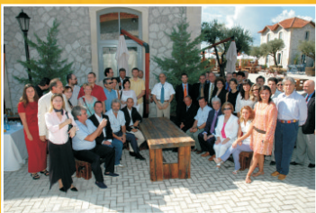
▼ Partnerský výbor v Hranicích 18.5. 2006 (ČR)