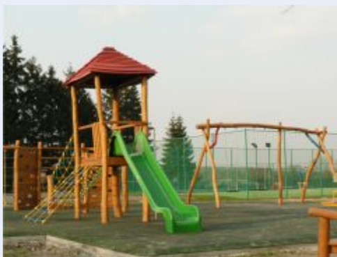
V areálu se vyřádí i děti

Sportovní klub Petanque Hranice – Valšovice každoročně pořádá tři turnaje. Prvomájové koulení je turnaj zařazený do termínové listiny České asociace pétanque klubů (ČAPEK). Valšovický pohár spolu s dětskou soutěží Prázdninové koulení má regionální charakter, je zaměřen i pro neregistrované hráče a letos proběhne 14. 8. 2010. Svatováclavské koulení s termínem 25.9.2010 je opět zařazeno