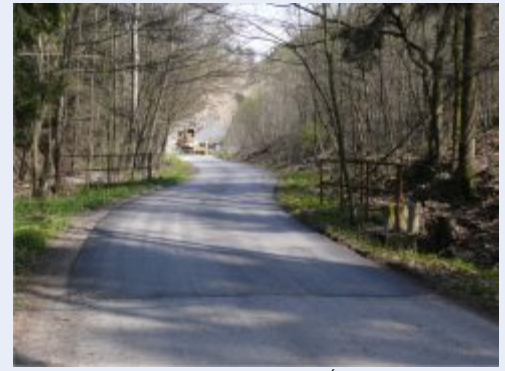
Úsek lesní cesty u Nejdku

října by měl doporučení Rozvojového partnerství posvětit Státní zemědělský intervenční fond a pak už nic nebude bránit příjemcům, aby se pustili do realizace svých záměrů a dále tak rozšířili okruh již 25 subjektů, které dotaci obdržely v minulých dvou letech.