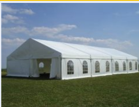
Podobné stany budou již brzy sloužit na Hranicku

Do hlavní fáze realizace se posunul společný projekt třech místních akčních skupin z různých koutů naší republiky, který výrazně napomůže kvalitě kulturního a sportovního života na Hranicku. Rozvojové partnerství Regionu Hranicko si v rámci něj pořídí sadu mobilního vybavení v celkové hodnotě 1.580.000,- Kč, které bude využívat nejen na akcích svých, ale bude jej zapůjčovat za provozní náklady nejruznějším pořadatelům nekomerčních akcí v regionu. Projekt doplní také několik doprovodných aktivit.