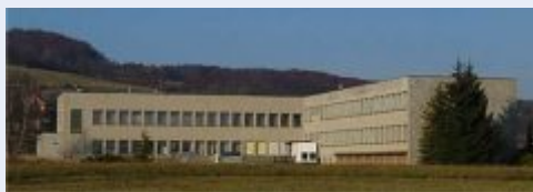
Druztvo Střež nad Ludinou – „Bílý dům“

V těchto dnech je dokončována internetová databáze, která bude od poloviny roku nabízet volné prostory zájemcům z řad podnikatelů i neziskových organizací. Databáze, umístěná na internetových stránkách www.regionhranicko.cz , uživatelům umožní výběr z palety různých objektů vhodných pro kancelářské prostory, výrobu, skladování, obchod nebo zájmové aktivity. Jejím cílem je usnadnit odbyt objektů ležících ladem. Nebude se jednat jen o celé objekty, ale nabídka by měla obsahovat