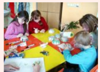
Velikonoční dílny v ZŠ Hustopeče nad Bečvou

škol a partnerských organizací ve městě Kolonowskie.