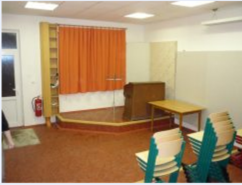
Nová zkušebna Dechové hudby Hustopeče n.B.