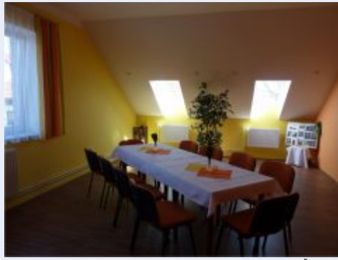
Volnočasové centrum ve Špičkách