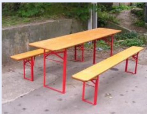
K dispozici bude též 20 sad pivních setů

ších nebo 2 hojněji navštívené akce. Vybavení doplní 20 ks tzv. pivních setů, tedy lehkého přenosného stolu s 2 lavicemi. Pro jarmarky a řemeslníky bude určeno 6 ks stylových dřevěných prodejních stánků se snadnou montáží a převozem. K obohacení programu akcí jistě přispěje kvalitní zvuková a obrazová aparatura, která se bude skládat ze dvou odolných a výkonných reproduktorů na stojanech, jednoduchého malého mixu, dvou bezdrátových mikrofonů, dataprojektoru a plátna. Až vysoutěžené nabídkové ceny