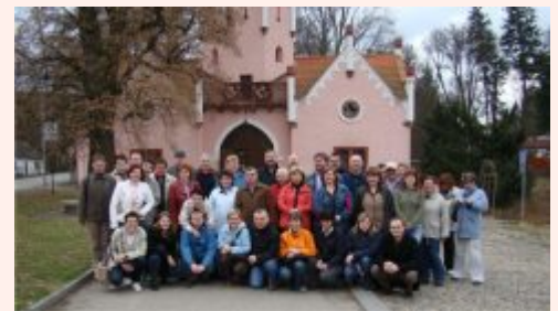
Zástupci regionu Hranicko ve Vlašimi

V pátek podnikli účastníci studijní cesty exkurzi po zajímavých projektech v regionu, které byly realizovány v rámci Programu LEADER. V průběhu celého dne navštívili renovovanou kapličku v osadě Čelivo, malé hasičské muzeum a opravenou hasičskou zbrojnicí v Ratměřicích. V této obci účastníci navštívili také opravený kostelík, zámek a zámeckou zahradu. Poté přešli do obce Odlochovice, kde se nachází zajímavé hasičské muzeum, které bylo také rekonstruováno za pomoci finančních prostředků Programu LEADER. Další kroky vedly na známou koňskou farmu Heroutice, kde kromě prohlídky stájí, seznámili majitelé farmy všechny přítomné s historií a hospodářským farmy. Posledním místem exkurze byl kulturní dům v Týnci nad Sázavou, který dříve sloužil jako továrna na kamečinu. Nový majitel začal s postupnou rekonstrukcí objektu, v rámci které bude objekt proměněn v multifunkční společ-