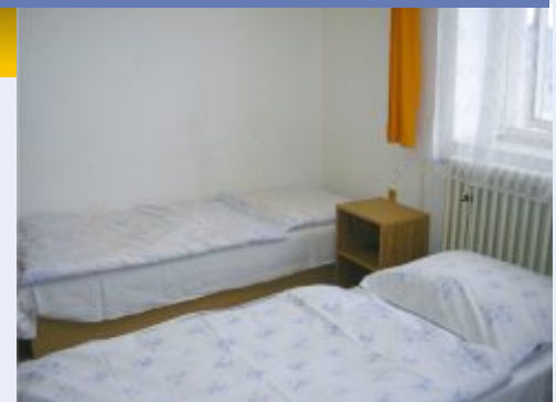
Společnost Nový dvůr provozuje ubytovnu v Hustopečích n.B.

V roce 2004 se společnost rozhodla převést nákladnou přestavbu bývalého kravína na dílny a sklady. Během jednoho roku vzniklo pět dílen (skladů) o různé výměře se samostatnými přípojkami elektrické energie a plynu a se společným sociálním zařízením. V současné době jsou všechny prostory pronajímány a v jejich prostorách sídlí autoopravna