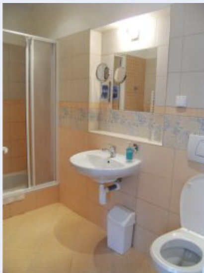
Nové sociální zařízení pokojů v penzionu Ostravka

V minulém zpravodaji jsme si představili 9 ukončených projektů, které začátkem roku doplnily poslední dva, čímž se definitivně uzavřela realizace 11 projektů podpořených v prvním kole programu