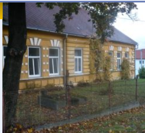
Jedna z expozic bude umístěna v bývalé býškovické škole

Projekt se rozběhne během května, kdy bude vybrán dodavatel stavebních prací, po celé léto se bude rekonstruovat, nakupovat vitríny a vytvářet popisky exponátů. Obě expozice se mohou opřít o pečlivou přípravu obsahu, která proběhla v rámci nedávno ukončeného projektu Mikroregionu Hranicko. Díky němu se v obou obcích několikrát sešla pracovní skupina složená z místních zájemců a znalců historie a pod vedením odborného lektora skládala zaměření expozice tak, aby byla