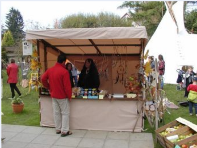
Na jarmarcích bude možno využít dřevěných prodejních stánků

Podrobnosti a aktuální informace o realizaci projektu hledejte na webu www.regionhranicko.cz v oddílu Rozvojové partnerství → Projekty Spolupráce