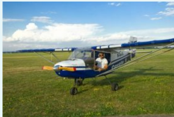
Lety letadlem a akrobatické lety jsou jedny z nově nabízených balíčků zážitků

Spuštěním rezervačního systému má region Hranicko, jako jeden z prvních v Olomouckém kraji, velkou výhodu v „získávání“ turistů a návštěvníků. Rezervační systém se stal součástí turistického