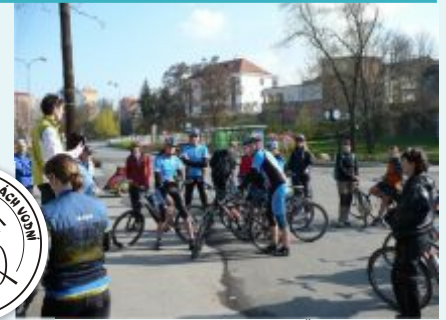
Tradiční sraz na Šromotově náměstí