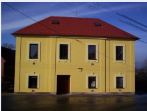
Obecní dům v Dolních Těšicích

Po ukončení sběru projektů 30.4. už víme, že se sešly žádosti od celkem 19 zájemců, kteří požadují celkem 10.228.471,- Kč finančních prostředků. To je asi o půl mili-