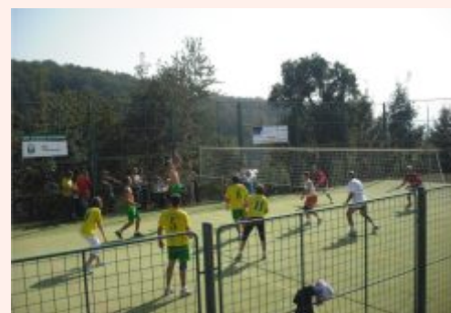
Hodový volejbalový turnaj ve Stříteži nad Ludinou 2009