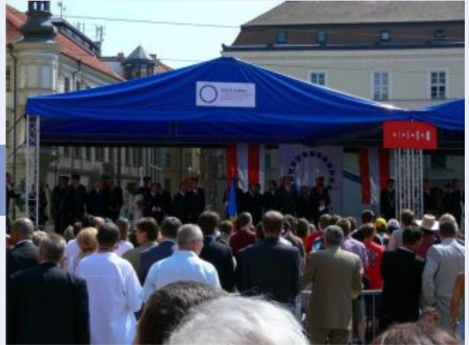
Podobné podium 6x8m bude mít základnu v Hustopečích n.B.

zda a jaké vybavení je pro daný termín k dispozici. Členové Rozvojového partnerství budou zvýhodněni možnostmi zamluvit si přednostně několik termínů, u ostatních pořadatelů bude rozhodovat více faktorů, např. včasnost objednávky, četnost zapůjčování, zájem Rozvojového partnerství stát se spolupořadatelem apod. Zkušební provoz také nastaví a ověří úroveň manipulačních poplatků, tedy částky, kterou pořadatel za