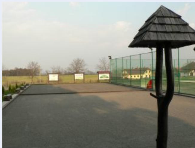
K dispozici je celkem 22 drah