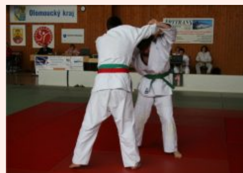
Dorostenecká liga v JUDU 2009