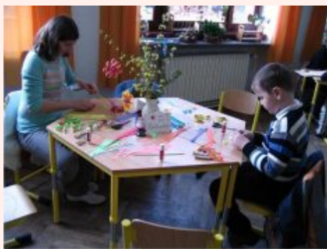
Velikonoční dílny v ZŠ Hustopeče nad Bečvou

V září letošního roku se rozjede na třech základních školách z hranického regionu projekt nazvaný S přírodou a tradicemi společně, na kterém budou školy po dobu jednoho a půl roku spolupracovat s partnerskými školami z města Kolonowskie. V rámci projektu, který bude podpořen z Operačního programu Přeshraniční spolupráce Česká republika – Polská republika 2007 – 2013, budou české a polské školy spolupracovat při organizaci aktivit z oblasti environmen-