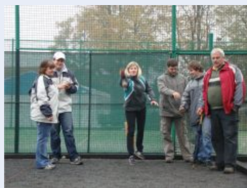
Turnaj v rámci Dne s regionem Hranicko proběhne letos už počtvrté

Valšovické hřiště na pétanque se skládá z 10 drah na hlavním dvorci a dalších 12 se nachází hned vedle na dvorcích vedlejších. Povrch je šterkový se šotolinovým podkladem. Rozměry hřišť jsou jednotné, a to 12,5x3 metry. Osvětlení je již plně funkční. Sportovní areál zahrnuje taky hřiště na fotbal a už také funguje kurt na tenis, volejbal a nohejbal. Na své si zde přijdou i děti, protože jsou tu atrakce i pro ně. Nachází se zde i plně funkční bufet a sociální zařízení, takže není problém pořídit turnaje vysoké úrovně.