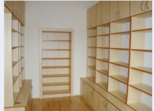
Nová knihovna v Radíkově

Finišuje se už také u několika příjemců z druhého kola realizovaného v roce