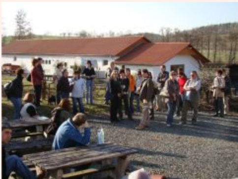
Návštěva koňské farmy Heroutice

Po celou dobu studijní cesty bylo krásné počasí, účastníci se dozvěděli mnoho zajímavých informací o regionu i o projektech v regionu realizovaných a mohli tak načerpat nové nápady do budoucna.