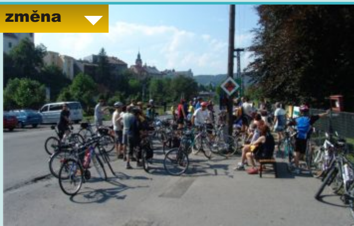
Zahájení Mlynářského krajánka