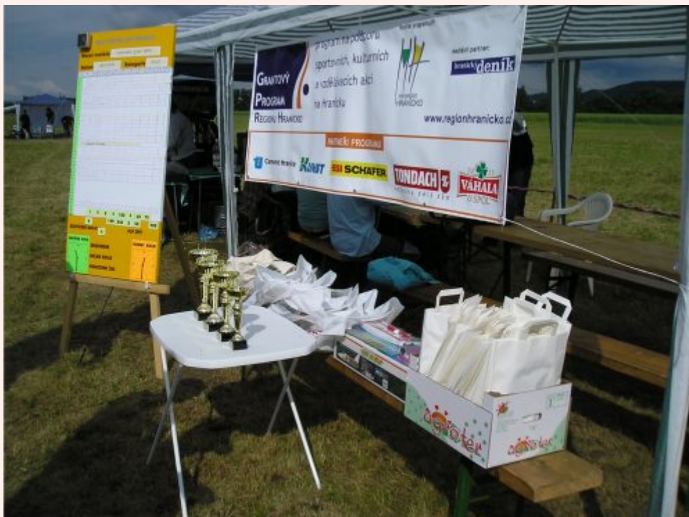
Hranická „EJKA“ 2009

Druhou oblastí jsou akce rozvíjející tvůrčí a sportovní potenciál dětí a mládeže , jako hudební a sportovní akce podporující tvořivost dětí nebo akce zaměřené na místní řemesla.