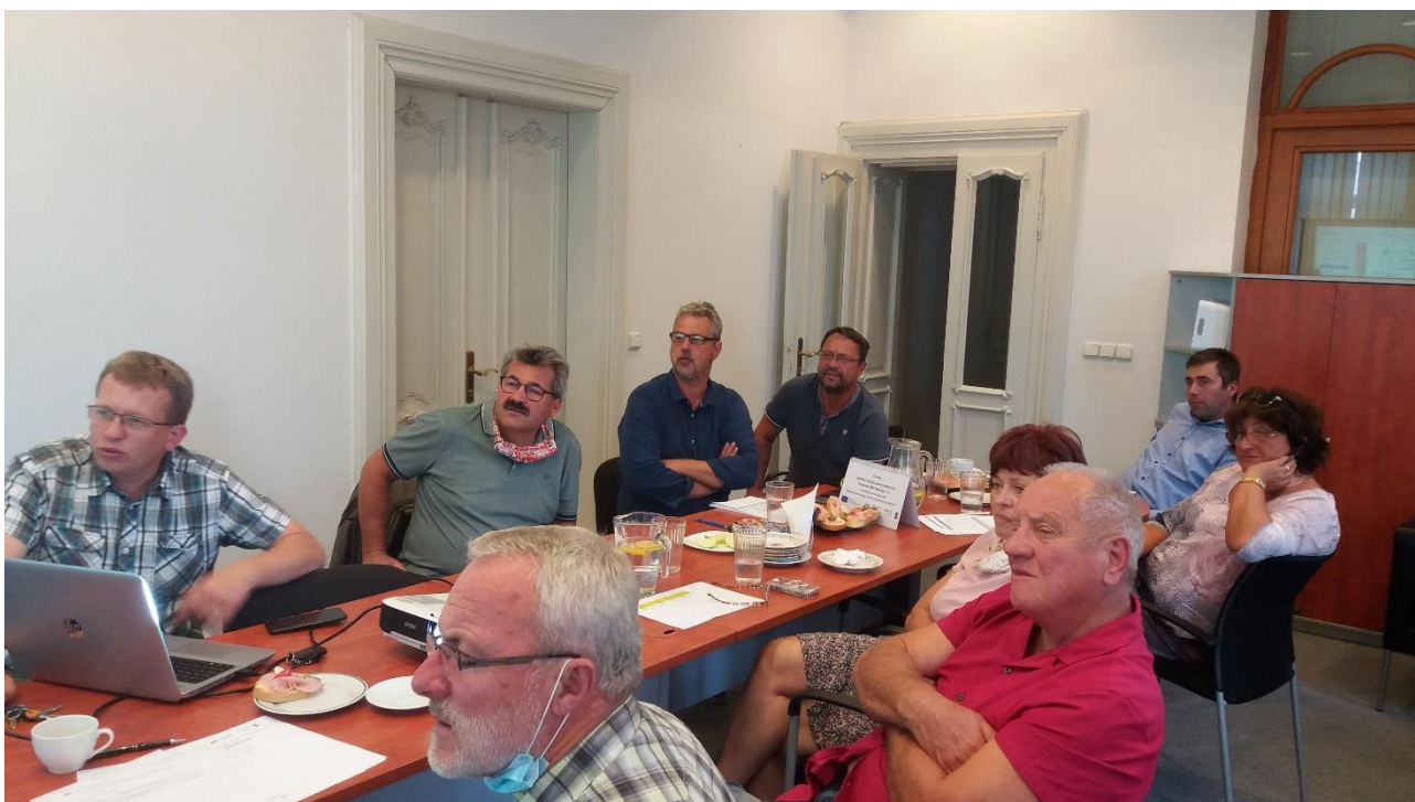
Jednání Výběrové komise MAS 21.9.2020

22.12. 2020 11. výzva MAS-IROP Bezpečnost dopravy III., 12. výzva MAS-IROP Cyklodoprava II.