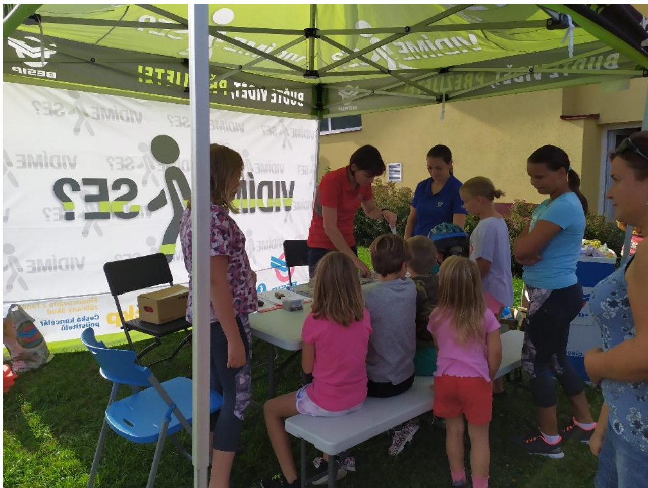
Projektový den s krajským koordinátorem BESIP

Rok 2020 byl 2x poznamenán vyhlášením nouzového stavu a zákazem realizace aktivit. I proto byly zrealizovány v rámci projektu zatím pouze 2 projektové dny v klubovně – jeden ve spolupráci s hasiči, další ve spolupráci s krajským koordinátorem BESIP pro Olomoucký kraj.