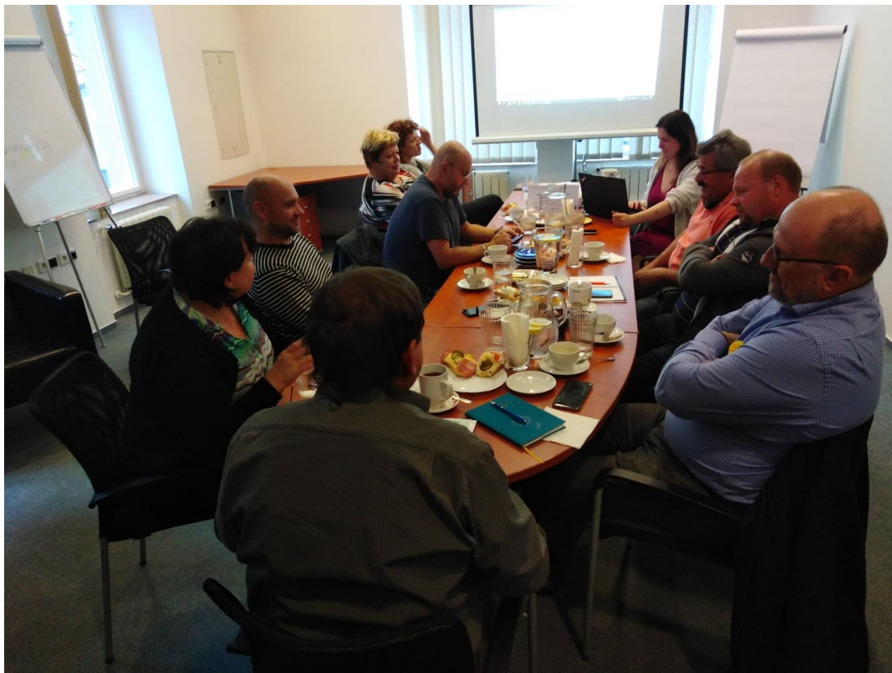
Jednání Výboru MAS 26.9.2020