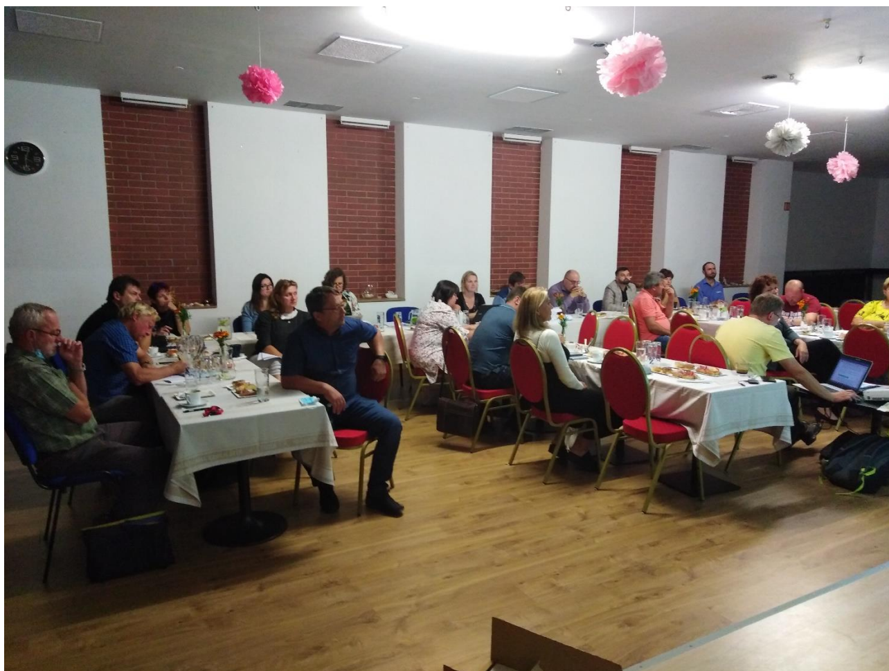
Zasedání Valné hromady MAS Hranicko 22.9.2020 v Olympia klubu na Radniční 68