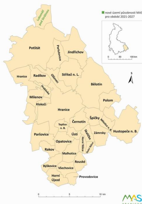
ÚZEMNÍ PŮSOBNOST MAS HRANICKO Z. S. v období 2021 – 2027

MAS v roce 2020 oslovila všech dosavadních 31 obcí se žádostí o schválení znovuzařazení obcí do území působnosti MAS Hranicko na programovací období 2021-2027. Předseda Výboru MAS začátkem června 2020 oslovil starosty všech 32 obcí ORP Hranice se žádostí o schválení zařazení území jejich obce do území působnosti MAS Hranicko. Požadavek na schválení území zastupitelstvy je vlastní iniciativou MAS, která tímto chce, aby zařazení obce do území MAS stálo na širokém konsenzu zastupitelů obcí, nejen na rozhodnutí starosty. Během září a října svým podpisem všech 31 starostek a starostů projevilo zájem o pokračování naší spolupráce na dalších 7 let.