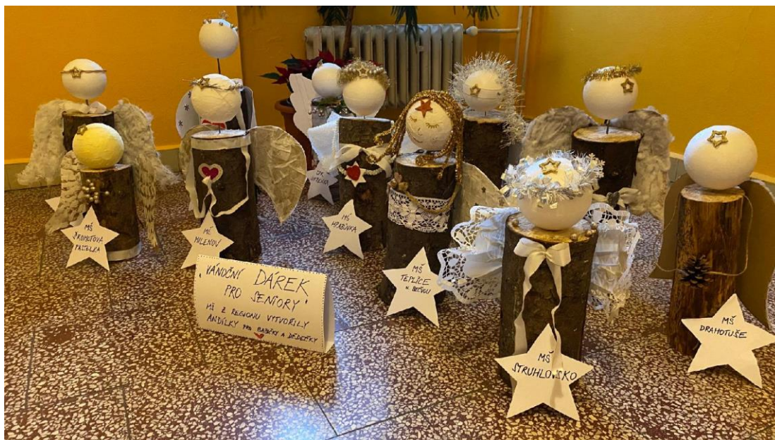
Vánoční projekt MŠ z regionu: „Dárek pro seniory“